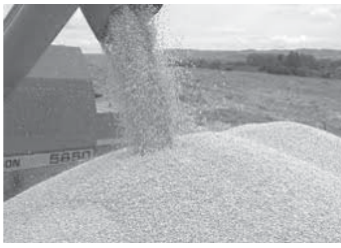
伯国のトウモロコシ収穫の様子