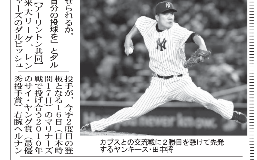
カブスとの交流戦に2勝目を懸けて先発するヤンキース・田中将

【共同】米大リーグ、ヤンキースの田中将が15日のオリオールズ戦で本拠地初登板を果たした。今回は中5日の間隔で2度目の本拠地登板に挑む。試合は9時5分開始。田中将は15日午前8時5分開始のオリオールズ戦で本拠地初登板を果たした。今回は中5日の間隔で2度目の本拠地登板に挑む。試合は9時5分開始。田中将は15日午前8時5分開始のオリオールズ戦で本拠地初登板を果たした。今回は中5日の間隔で2度目の本拠地登板に挑む。試合は9時5分開始。