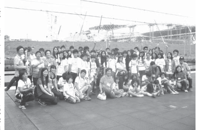
林間学校に参加した子どもたち