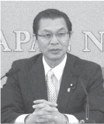
安倍首相は30日午後、東京・内幸町の日本記者クラブで記者会見し、今夏の代表選実施も言及した。

同時、「次のランナー」に、どのタイミングでバトンタッチするかは海江田氏がリーダーとして判断すべきだ」と語った。