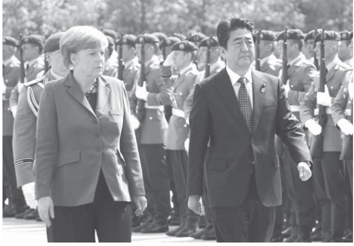
ドイツのメルケル首相(右)の出迎えを受ける安倍首相=30日、ベルリン

【ベルリン共同】安倍首相は30日午後（日本時間同日夜）、ドイツのメルケル首相とベルリンで会談し、ウクライナ情勢の安定に向けて連携を強化する方針で一致した。