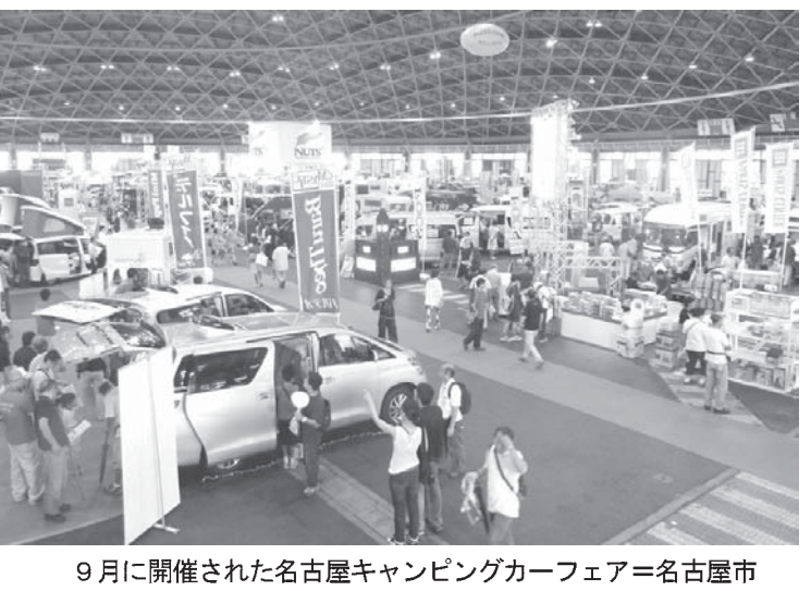
9月に開催された名古屋キャンピングカーフェア＝名古屋市

【共同】キャンピングカーの売れ行きが好調だ。ユーザーは60代が最も多く、車中泊による「夫婦2人旅」が人気を集めている。日程も目的地も決めずに車でふらりと家を出る。こんな旅のスタイルを求めている人たちが増えているようだ。