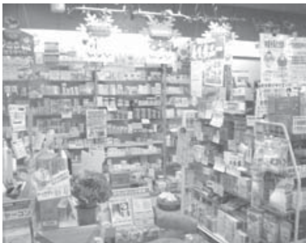
健康食品の約4割は医薬品の効き目を低下させる

【共同】市販されている健康食品の約4割に、体内で薬や毒物の成分を分解、排出する「薬物代謝酵素」の働きを促す作用があり、医薬品の効きを低下させるとの結果を厚生労働省研究班が明らかにした。逆に関心するものも少なくない。