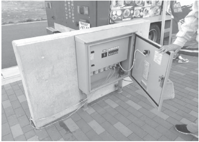
「RVパークおた」の電源供給設備＝群馬県太田市

昨年9月14、15日に開催された名古屋キャンピングカーフェアには、2日間計約2万7千人が詰めかけた。120台もの多種多様なキャンピングカーがずらりと並び、来場者は車に乗り込み、各メーカーが趣向を凝らして改装した「インテリア」を確かめているという。