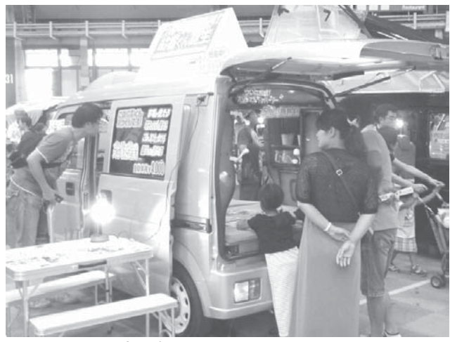
名古屋キャンピングカーフェアで、軽自動車ベースにしたキャンピングカーを興味深げに見る親子連れら＝名古屋市

【共同】キャンピングカーの売れ行きが好調だ。ユーザーは60代が最も多く、車中泊による「夫婦2人旅」が人気を集めている。日程も目的地も決めずに車でふらりと家を出る。こんな旅のスタイルを求めている人たちが増えているようだ。