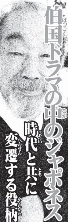
時代と世に 変遷する役柄

「クイアバで開かれた」と題された一枚のチラシには「ゴールの瞬間の置き引きに注意」などの安全対策の基本が記されている。 「クイアバで開かれた」と題された一枚のチラシには「ゴールの瞬間の置き引きに注意」などの安全対策の基本が記されている。