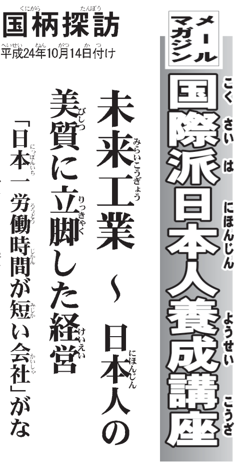
未来工業株式会社

「参考文庫」1、山田昭男「日本でいちばん社員のやる気がある会社」中経出版、平成22年