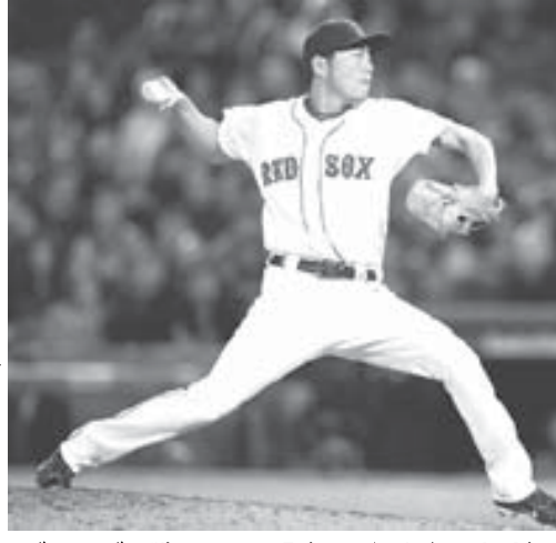
プレーブスの9回に登板し、無失点で今季初勝利を挙げたレッドソックス・上原

米大リーグ 【ボストン共同】米大リーグは29日、各地で行われ、レッドソックスの上原はボストンでのプレーブスの9回に登板し、無失点で今季初勝利を挙げた。上原は4連勝となり、チームは4勝1敗1無失点の好成績を挙げた。