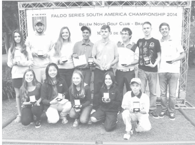
各カテゴリー優勝者の皆さん

ヤード、パー72、54ホール、ストロークプレーで開催された。ブラジル、アルゼンチン、チリ、ウルグアイ、ペルーから総勢99人の男女ジュニアゴルフ選手が参加、男女年齢別に全9カテゴリーに分かれて腕を競った。