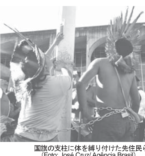
国旗の支柱に体を縛り付けた先住民ら

日付エスタード紙などが報じた。アジエンシア・ブラジルの報道によれば、首都では26日と29日の4日間、先住民全国運動(Mobilização Nacional Indígena)と呼ばれる運動が計画され、約1200の部族の先住民が集まった。これは、現在議会で審議されている先住民の土地の権利を狭めるような連