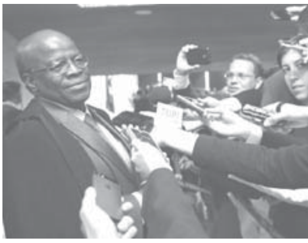
最高裁からの引退を表明したバルボザ氏