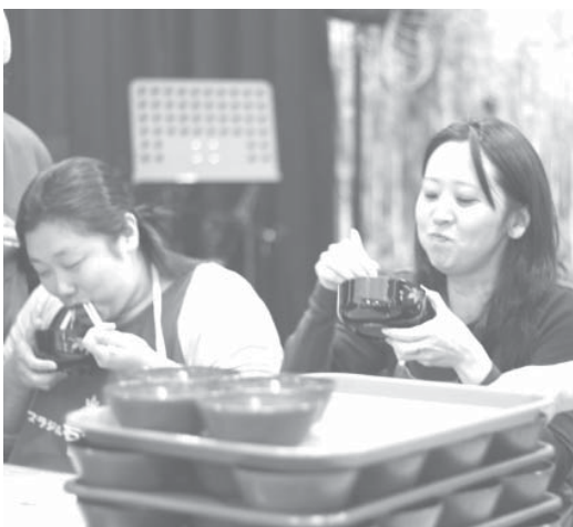
女性陣の活躍に会場が沸いた

動きで出場者の記録をアシストした。千田会長は「雨模様といくつものイベントが重なり、客入りを心配したが、大入りだった。年一回の