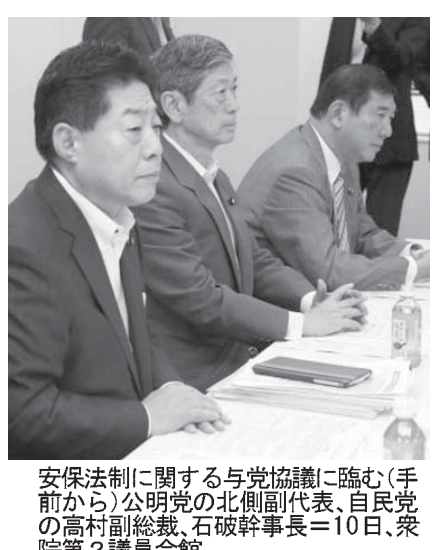
（手前）安倍首相、高村正彦副総裁らと会談する。高村氏は「国会中に『集团的自衛権』という言葉を使わないで、自公両党が合意できるような調整してほしい」と語った。

【共同】安倍首相は10日、自民党の高村正彦副総裁と官邸で約30分間会談し、集団的自衛権行使を可能とする憲法解釈変更に向けた閣議決定について公明党との調整加速を指示した。高村氏に「国会中に『集团的自衛権』という言葉を使わないで、自公両党が合意できるような調整してほしい」と語った。内閣法制局が憲法解釈変更を提起する閣議決定原案を了承したことも分かった。公明党は解釈変更にも依然否定的で、連立与党の溝は深まっている。20日前後の閣議決定を目指す首相は、手詰まり状態からの打開策を「前向きに検討する」と高村氏に伝えた。22日の国会会期末へ綱引きが続くが、落としどころは見えていない。