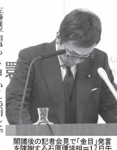
石原知事(左)が17日、福島県庁で記者会見し、福島県内での除染作業について説明した。

【共同】石原知事環境相は17日の閣議後会見で、除染廃棄物を保管する中間貯蔵施設をめぐり、福島県側との交渉を「最後は金目し」と発言した問題について「全くの誤解、私の品を欠く発言で不快な思いをされた方におわびしたい」と陳謝した。