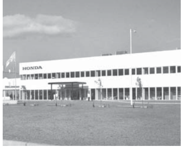
ホンダのアルゼンチンでの工場

他方、ホンダの場合も850人の従業員を1カ月の自宅待機とすると発表された。この間、給与は全額支払う。他の自動車メーカーは週当たり1日あるいは2日の生産停止とする対応が中心だが、労働組による、自動車部品業界では既に解雇の動きが始まっている。