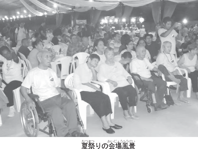
夏祭りの会場風景

また、金魚すくいの子供たちの人気が高かった。最後は恒例の樽太鼓を叩んで盆踊りで盛り上がった。(パラ州通信員 下小園昭仁)