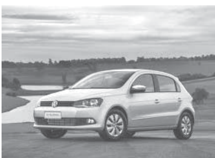
大衆車の代表格のGoI

ローンに対する審査の厳格化やインフレの昂進といった要因が、大衆市場の売れ行きに影響を与えている。 2014年1-5月期 減だが、1・0リッターの新車販売台数は、全体以下の大衆車に限定するで見れば前年比5・5%と、販売台数は同じ期間