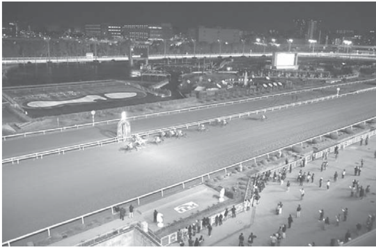
東京・大井競馬場のナイター競馬「トウインクルレース」。照明にターゲットコースが浮かび上がる

【共同】照明に浮かぶターゲットコース。ゼッケンを着けたサラブレッドが砂を巻き上げ走り抜ける。観客の歓声とため息が夜空に響いた。 大井競馬場の予想屋は現在18人。主催者から1年更新の営業許可をもらう。日本中央競馬会（JRA）にはない地方競馬特有の存在。大井競馬を運営する特別区競馬組合は「客へのサービスの一環。飲食店も含め提供している」と説明する。しかし、予想屋は今、名古屋、笠松、園田など全国の競馬場を合わせても40人ほどしかいない。