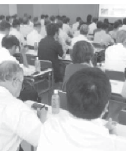
TOMAコンサルタンツグループが開いた問題社員対策セミナー

「赤字膨らむ地方競馬」地方自治体や自治体がつくる競馬組合が行う地方競馬は、現在14の主体が運営している。ピークの1991年度には入場人員約1466万人、売上約9862億円を記録したが、レジャーの多様化、景気後退などで2011年度は約371万人、約3314億円まで激減した。売り上げは各自自治体の財政に大きく貢献してきたが、近年は累積赤字が膨らみ、多くが存続の是非を問われている。