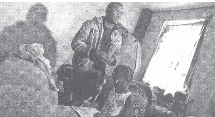
シネ・マロコスには内戦が続いていたシエラレオネを逃れて伯国に来た家族も住んでいる

聖市では4月以降、ハイチ人が急増し、市の特別の収容施設を用意したり、同国大使館の事務所を急遽開設との話が出たりもした。ハイチ人の急増は、2010年の大地震後に始まった同国からの不法移民の最初の受け入れ地となっ