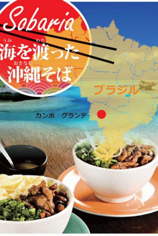
▲ブラジル人の口に合わせた沖繩そば

▲「パンもいけど、そばも食べてね」と麺を持ち上げ始めるパン屋の店員。今や沖繩そばはカンポ・グランデの市民食だ