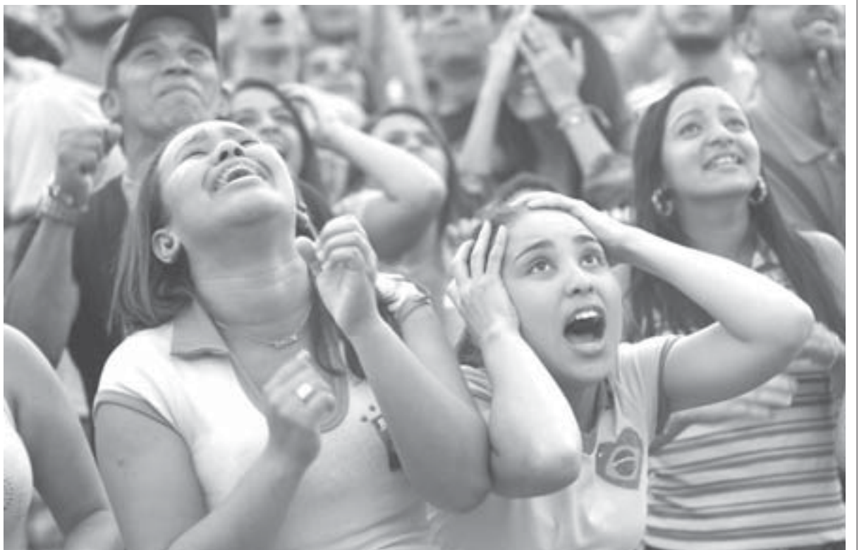
ブラジル代表の対メキシコ戦で一喜一憂する国民(17日、ブラジリア、Foto: Fabio Rodrigues Pozzebom/ Agencia Brasil)