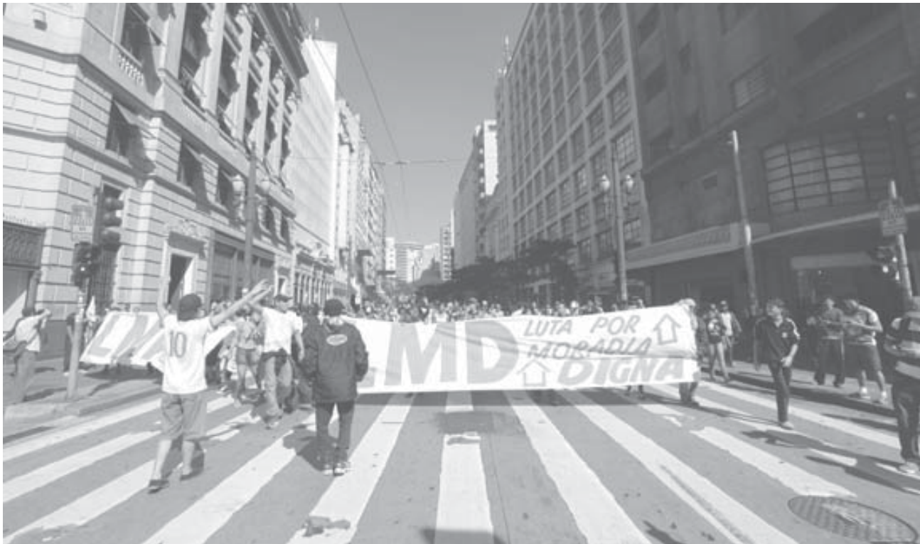
6月12日に市中央部で行われたLMDの抗議行動