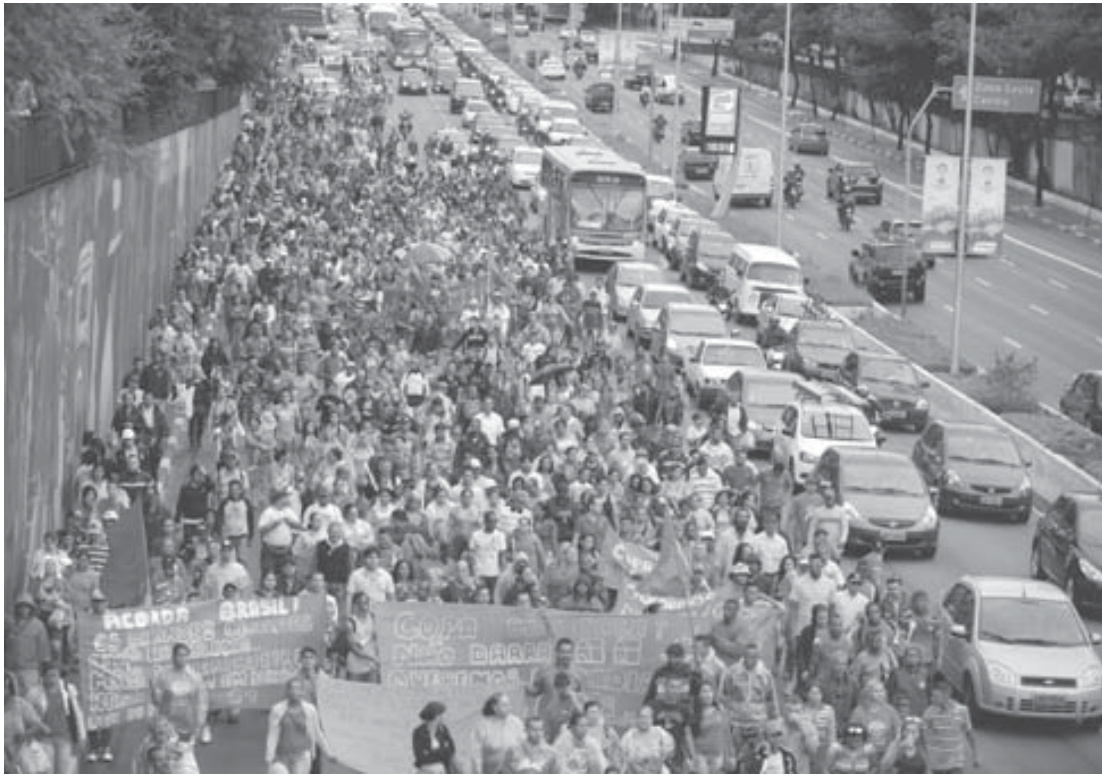
6月18日のMTSTのデモで埋まった聖市5月23日大通り

ハイチ人は、52家族が2階部分に住んでいる。3階に住んでいるのはカメルーンとドミニカからの人で、4階はペルー人やボリビア人、ベネズエラ人が暮らしている。5階は同性愛者やトラウマで、三つの階は外国人が占めている。同ビルに住む外国人の中で最も多い内戦が続いていた西アフリカのシエラレオネから