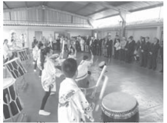
視察したドウラードス日本語モデル校で、太鼓を演奏した生徒達