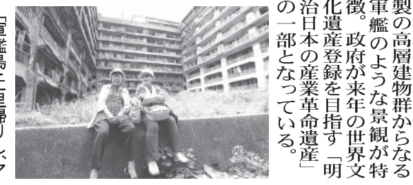
「軍艦島」に里帰りした元島民ら。背景には無人島の建物が見える。

【共同】「軍艦島」と呼ばれる長崎市の端島が、炭鉱閉山によって無人島になってから今年4月で40年となった。元島民ら約40人が5日、チャーター船で島に里帰りした。 【共同】「軍艦島」と呼ばれる長崎市の端島が、炭鉱閉山によって無人島になってから今年4月で40年となった。元島民ら約40人が5日、チャーター船で島に里帰りした。