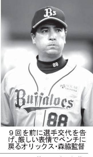
阪神の主力選手、藤原の活躍がチームを押し上げた