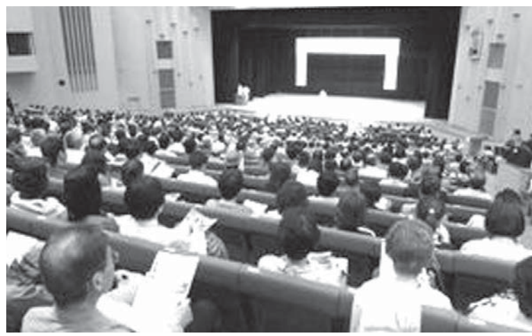
アルコール健康障害対策基本法推進の集い。会議には千人以上が詰めかけた

当事者や支援団体、医療や行政の関係者ら千人以上が都内に集まり、基本法推進で連携することを確認した。