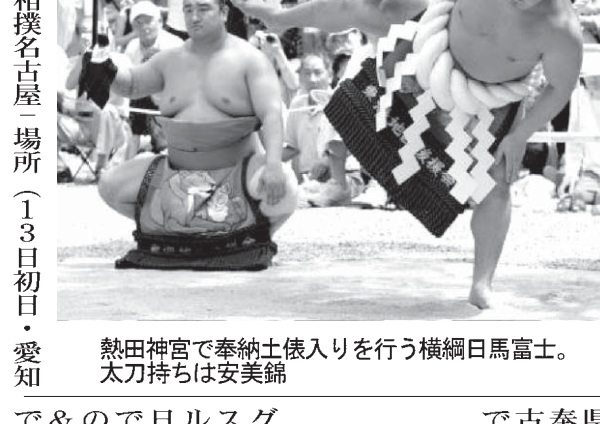
熱田神宮で奉納土俵入りを行う横綱日馬富士。太刀持ちは安美錦

【共同】大相撲名古屋場所(13日初日)愛知の熱田神宮で奉納土俵入りが行われ、14年ぶりに3横綱が参加した。観客は熱い拍手を送った。