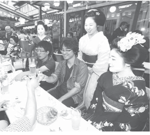
京都上七軒の歌舞練場にビアガーデンがオープンし、舞妓らのもてなしで乾杯する客。