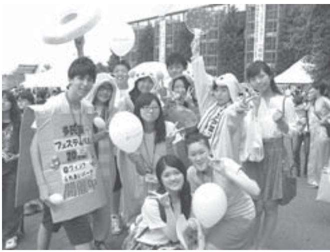
生徒に気負いはない(コリア国際学園)

【共同】在日コリアンの教育は、南北分断を背景に北朝鮮系、韓国系と別々の教育が担い、内容も政治体制を反映し大きく異なる時代が続いた。朝鮮半島というルーツを尊重しながらも、国家の壁にとらわれない学びを目指す取り組みが大阪で進む。 △コリアという意識 「アンニョンハセヨ」。郊外に立つ校舎の廊下を歩く、生徒から次々に声を掛けられた。大阪府茨木市のインテリナショナルスクール「コリア国際学園」には、中学1年と高校3年の86人が学ぶ。多くは在日コリアンだが、日本人、韓国からの帰国子女も在籍する。 今や在日コリアンの5人に4人は、いずれかの親が日本国籍を持つと言われ、学業や財界などで幅広く活躍する。学校は「本国」に倣う従来型