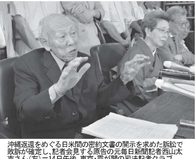
西山元記者ら（左）が、東京地裁で西山元記者らの上告棄却をめぐって、最高裁に上告した。判決は、最高裁が西山元記者らの存在を認め、開示を命じた。西山元記者らは、開示を求めた訴訟で、東京地裁で西山元記者らの上告棄却をめぐって、最高裁に上告した。判決は、最高裁が西山元記者らの存在を認め、開示を命じた。

【共同】1972年の沖縄返還をめぐる日米間の密約文書の開示を元毎日新聞記者西山元（82）らが求めた訴訟の上告審判決で、最高裁第2小法廷（千葉勝美裁判長）は14日、一審の開示命令を取り消した二審東京地裁判決を支持し、原告側の上告を棄却した。密約そのものの存在と、文書が過去に存在したことは否定せず、政府が文書を破壊した可能性があると認めた。西山元記者らの上告が棄却された。