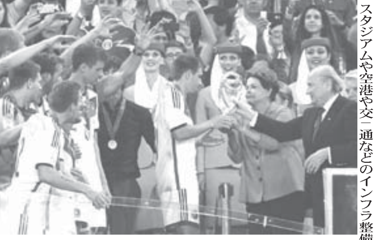
ドイツの優勝で幕を閉じたW杯

スタジアムや空港や交通などのインフラ整備の遅れや未成は、開催前に多くの不安を国内外に投げかけていた。14日付エスタド紙によると、2010年に連邦政府が公表したプロジェクトは83あったが、実際に手がけられたのは7に過ぎなかった。そして、政府の見積もりも甘く、当初235億レアルの予算が、実際には292億レアルにまで膨れ上がった。また、多くの都市で軽鉄道(VLT)の建設が頓挫したり、空港拡張などの工事が未完成で終わった。