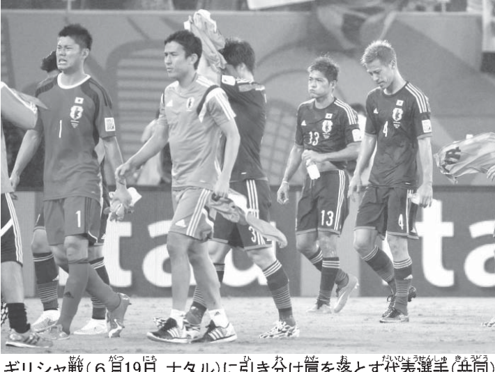
ギリシャ戦(6月19日、ナタル)に引き分け肩を落とす代表選手

「でも問題提起するマスコミも、世論も特に指摘しない」。どうやら日本サッカー界の成長は、その枠を超えた社会的な意識改革が求められているらしい。