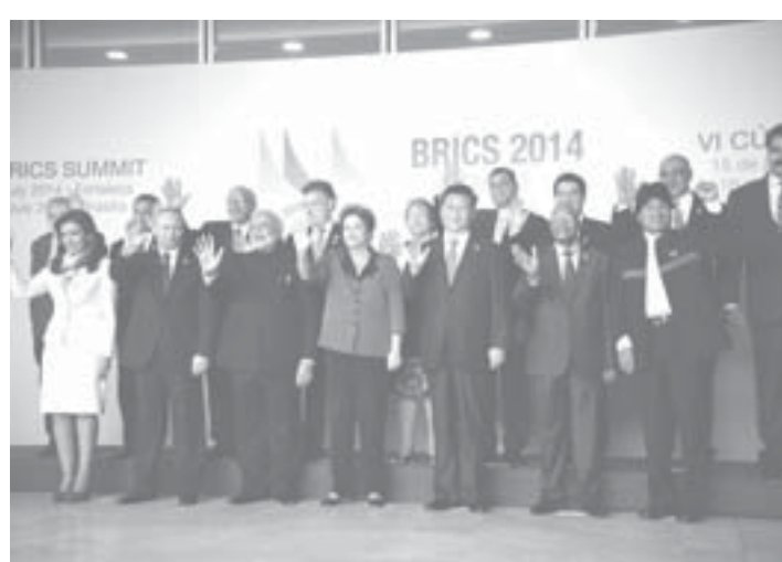
BRICSとUnasulの首脳たち

16日、BRICS5国の首脳たちと合同の会 議を行なった。この会議 で、ウナスール11カ 国は、15日に発足が決 まったばかりのBRICS 開発銀行に関する意見 交換などが行なわれた。 この会合はウナスール 諸国の大統領たちに好意 的に迎えられた。ベネズ エラのニコラス・マ ドウロ大統領やベルリ オジャロ大統領やウラ グアイアス州知事、ウ ナスールが手を取り合っ た歴史的な日だ、と新興 国間の交流の可能性が開 けたことを絶賛した。