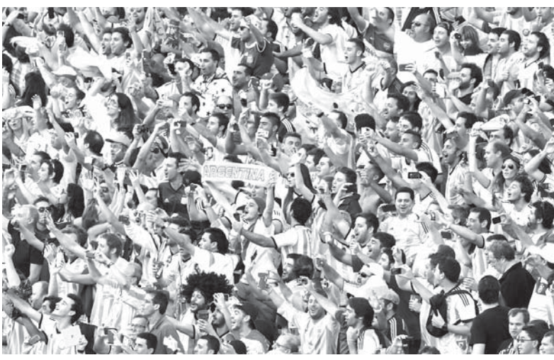
決勝戦会場で熱烈に声援を送るアルゼンチンの応援団

ニユースも多かった。選手らを祝福しようと町へ出た人々を結局は妨げる結果がそれである。また、ドイツ代表が帰国後の優勝祝賀行事で「ガウチヨはこんな風に行くんだぜ」とアルゼンチンに差別的なユーモアで皮肉ったことも問題になった。どこまでもサッカー