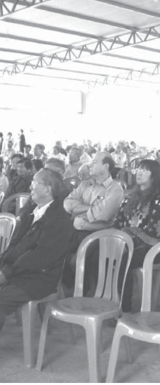
新設された屋根付きのイベント会場

茂木会長は「泥炭を売った収入で900平米の屋根付きイベント会場を建設できた。今後も移住地発展のため、地下資源を有効に活用したい」と、運営資金確保に明るく話した。