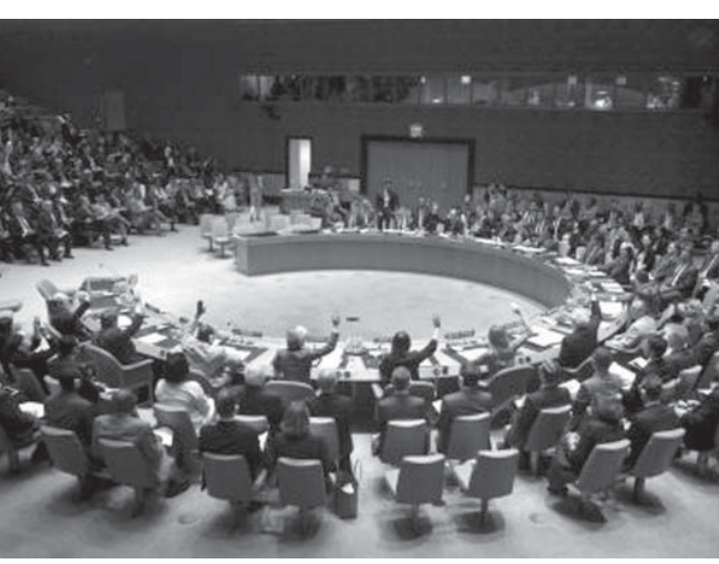
航空機墜落現場への立ち入りをめぐる決議案を採決する国連安保理理事会の会合=21日、ニューヨーク

【ニューヨーク、ハリコフ共同】国連安全保障理事会は21日、29人が死亡したウクライナ東部のマレーシア航空機撃墜を非難し、現地を支配する親ロシア派組織に現場保存を要求、関係国に原因調査への協力を求める決議案を全会一致で採択した。理事国からはロシアに対し、親口派組織への影響力行使を求める声が相次いだ。