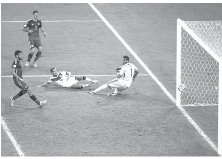
延長戦後半にドイツが得点した瞬間

【らぶら】報知7月22日「ワールドカップが終わり、まだ喪失感が抜けない。日本が勝もせずグループリーグを敗退したショックは、もう過去となり忘却の彼方に過ぎ去った。グループリーグを勝ち進み、毎回の試合を