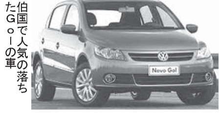
伯国で人気の落ちたGolの車

主要メーカーの販売台数が7.3%落ち込む一方で、売上ベースでは差し引きすると757億レアルから735億レアルへ3%減と、台数ベースで語られる業界の不振などには落ち込んでいない。この差が最も大きいのがフォードで、上半期の売上は70億レアルで