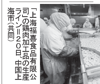
上海福喜食品有限公司の鶏肉加工品の生産ライン=22日、中国上海市

【共同】日本マクドナルドは22日、使用期限切れの鶏肉を供給した中国の食品会社から、国内で販売する「チキンマツクナゲツト」の約2割を輸入していたと発表された。「ガーリックチキン」を販売するマクドナルドは、この食品会社から輸入していた。両社は販売を中止し、輸入品が実際に期限切れだったかどうかを調べている。日本マクドナルドがこの食品会社から輸入した鶏肉を過去に使用したことがある店舗は、国内全体の約4割に当たる約340店舗、店舗のある場所には茨城、栃木、群馬、埼玉、千葉、東京、神奈川、新潟、山梨、長野、静岡の1都10県にわたり、影響が広がった。