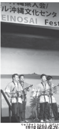
琉球民謡保存会・ニーセーターの演奏

財政難に解決の目処が立ちました。島人の温かさを感じます」と感謝を述べた。行政指導により、エレベーター設置を含む改修工事を行ったため、財政難に陥っていた。去年から資金カンパイベ