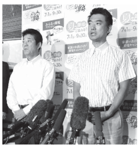
法定協議会を終え、記者の質問に答える橋下徹大阪市長。左は松井一郎大阪府知事

【共同】大阪都構想の法定協議会を、大阪府議会が23日、大阪府庁で開いた。定数20のうち、大阪維新の会（代表・橋下徹大阪市長）の委員が11人が出席し、市を解体して5特別区分に分けた府とともに行政機能を再編する都構想の設計図に賛同した。協議会を完了させた。大阪維新が都構想反対の会派の法定協議会への参加を拒否し、市議会の他会派は強硬に反対した。橋下市長は協議会を9月開