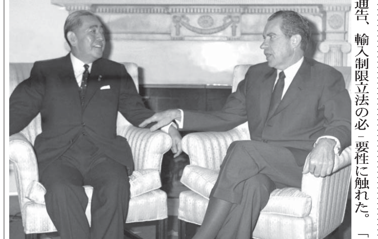
1969年11月、米ホワイトハウスで日米首脳会談を行う佐藤...