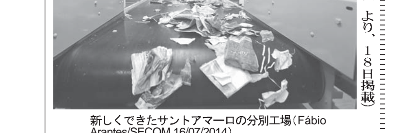
新しくできたセントアマーロの分別工場 (Fabio Arantes/SECOM 16/07/2014)