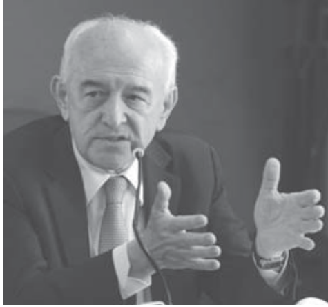
6月の雇用創出数に関して語るディ・アス労働相