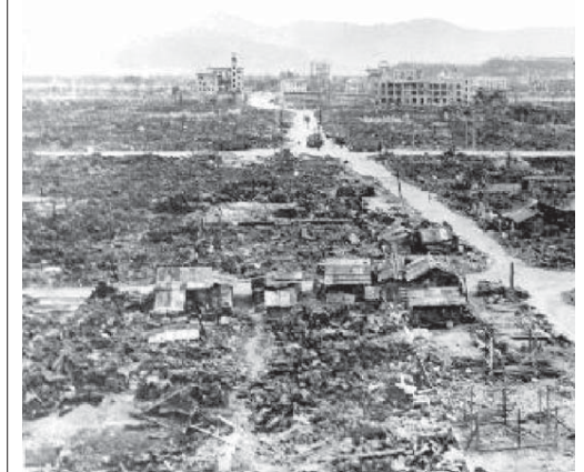
1945年、マンハッタン工兵管区調査団が広島中央電話局西分局から撮影した町並み。中央奥に原爆ドームが見える

【共同】広島市の原爆資料館は23日、原爆投下後の1945年秋ごろに米国調査団が撮影した町並みや建物などの写真176点と米国国立公文書館で入手したと発表した。うち30点を報道陣に公開した。長崎原爆資料館も23日、同公文書館で入手した町並みや建物などの写真176点と米国国立公文書館で入手したと発表した。うち30点を報道陣に公開した。長崎原爆資料館も23日、同公文書館で入手した町並みや建物などの写真176点と米国国立公文書館で入手したと発表した。