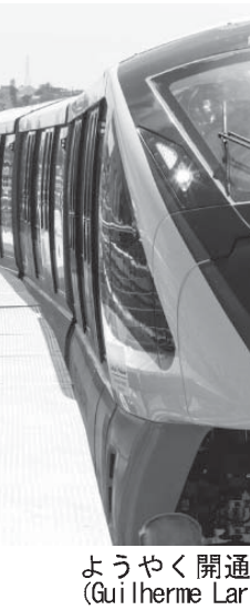
ようやく開通する聖市のモノレール

ミリー開発で、25億が投入される見込みだ。南米GM社のジャイム・アルシラ社長は「この投資で技術と品質に焦点を当てた製品開発の継続が可能となる」とした上で、「ブラジルで生産する製品は国内で生産した製品の比率も向上させる」と発言した。