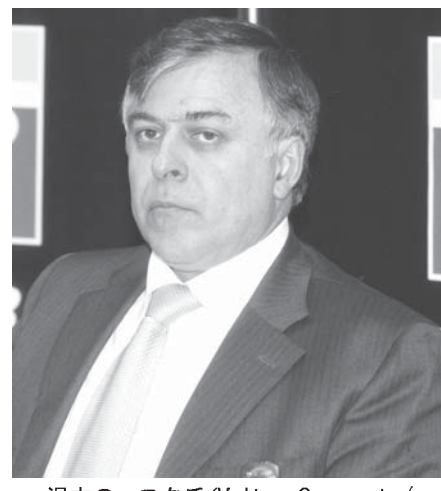
渦中のコスタ氏

カンポス氏は、この取崩計画には、労働者党(PT)や民主運動党(PMDB)の政治家が主に絡んでおり、コスタ氏はその中核を担っていたと見られる。コスタ氏は、ペトロbrasの供給部長在任中の2004〜12年の間に、同公社との契約を求