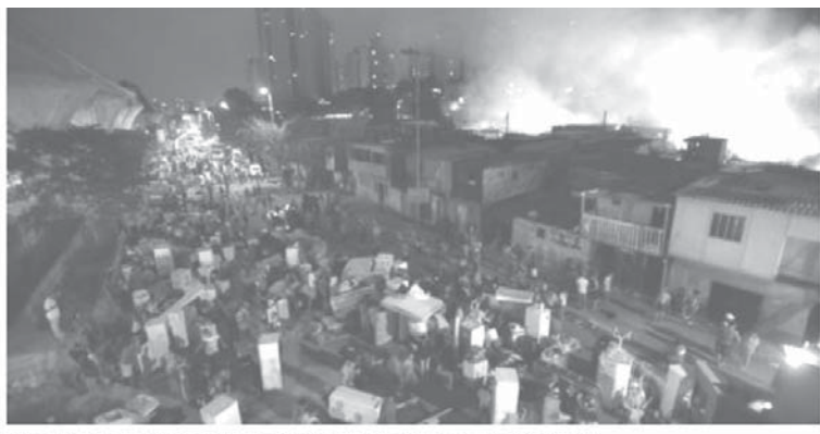
Incêndio atinge a favela Buraco Oriente, no Campo Belo, em São Paulo

聖市南部ジョルナリス・ロベルト・マリニョ大通り沿いにあり、建設現場からも近いファベラで7日午後9時頃、火災が発生。市防災局によれば500〜600軒のバラックや石造りの住居が焼失し、少なくとも住民2千人に影響が出たと各報が伝えている。消防当局は、火災の原因は不明だが、一酸化炭素中毒で入院した住民もいる。消防は8日0時半に大火を消し止めたが、残った火の消火活動は明け方まで続いた。同大通りには住民の家具、電化製品、マツトレスなどが広がった状態になった。同地域に住む会計士の女性(40)は、消防隊が現場に向かう途中に麻薬密売者らによる妨害もあったため、消防隊が消火活動を行なうことができなかったと語っている。