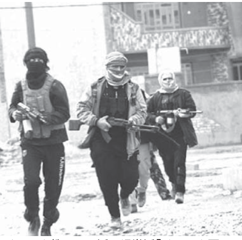
イスラム教スンニ派の過激派「イスラム国」の兵士たち

【共同】イスラム国家樹立のため命を懸ける。聖戦で死ぬ覚悟がある。イスラム教スンニ派の過激派「イスラム国」に合流するためシリアへの渡航を決めたインドネシア・ジャワ島スラバヤ在住の男性が8日までに、共同通信の取材に応じた。既に現地にいった仲間の手引きと潤沢な資金援助を背景に、身一つで戦闘地域に飛び込むと語った。