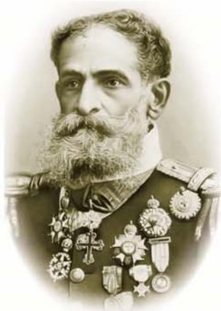
デオードロ初代大統領