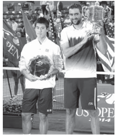
テニスの錦織圭(右)が、準決勝で全米オープン男子シングルスでテリッツにストレート負けした。