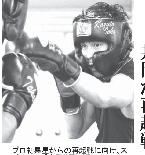
プロ初黒星からの再起戦に向け、スーパーリングする井岡一翔