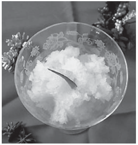
ユズシャーベット

ずると、きめの細かいふわふわのシャーベットになる。 ・ユズの果汁、皮の量は好みで調整してください。 ・卵白とユズの液が分離して凍る場合がありますが、途中で混ぜるので大丈夫です。 ・絞ったあとのユズの実や皮は、布等の袋に入れてお風呂に浮かせてお薬しみて下さい。血行を良くし、体温を上げる作用があるといわれています。 ・レモンなどでも、おいしくできます。※但し、レモンの場合は防カビ剤や農薬などの残留にはご注意ください。国産の無農薬のものを買えば大丈夫です。難しい場合は、塩でよくもみながら、しっかりと洗いましょう。 ユズ産地は、高知県が有名です。今回は、ユズを使