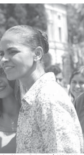
10日のマリーナ氏

エドゥアルド・カンボア氏の急死に伴い、8月20日に大統領選出馬を正式発表した直後、マリーナ氏は支持率はジウマ氏の支持率に急接近し、決選投票ではジウマ氏が勝利するとの予想が出ている。