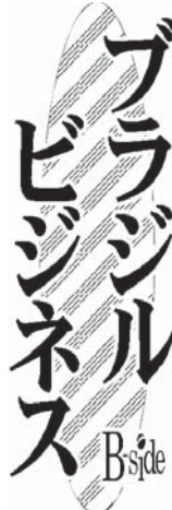
伯国の鉄鋼企業の仕事現場

術要件に与える影響は大きく、業界各社にとって問題になり得るとの見解を示した。ほぼフレックス燃料化されており、自由な生産は、この影響を受けない。問題視されるのは、国内の新車販売台数が約6%を占める、輸入車を中