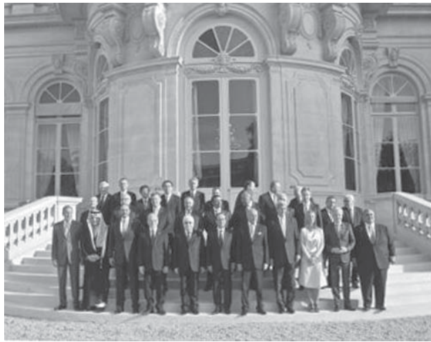
15日、パリで開かれた「イスラム国」対策を協議する国際会議の出席者ら