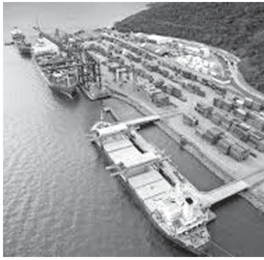
リオのイタグアイ港

これらの資源会社はリオ・デ・ジャネイロに拠点を置き、ブラジル南東部の鉄鉱石輸出のハブ港を目指している。このように批判は、リオ・デ・ジャネイロ州イタグアイ港の営業に集中している。