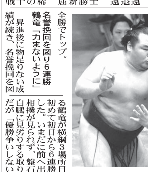
宝富士(右)を攻める鶴竜

【共同】大相撲秋場所6日目(19日)両国国技館。白鵬と鶴竜の両横綱、新人幕の逸ノ城がそれぞれ3場所連続31度目の優勝を挙げ、6連勝を挙げた。稀勢の里は1敗で稀勢の里、旭天鵬と隠岐の海、平幕2人が追う。十両は稀勢の里が6戦全勝でトップ。