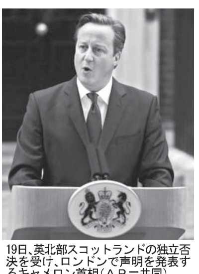
否決を宣言するスコットランド首相(左)と、英首相(右)の共同記者会見。19日、ロンドン。

【エディンバラ共同】英国からのスコットランド独立の是非を問う住民投票は18日夜、即日開票された。選挙管理当局は19日、最終結果は反対55・25%に対し賛成44・65%で、独立は否決されたと発表した。英政府は国土の3割、人口の8%を超えるスコットランド(人口約530万人)のつきなみに成功し、キャメロン首相は勝利を宣言した。