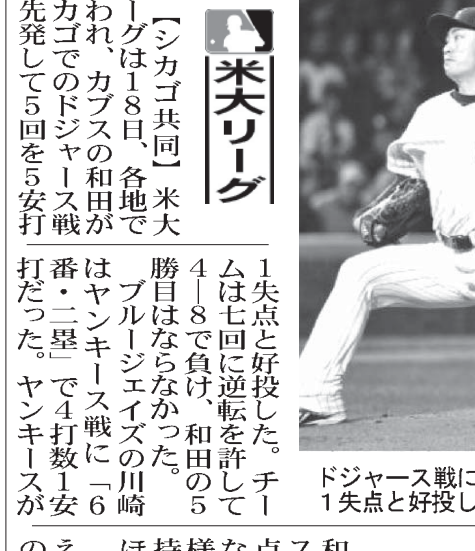
ドジャース戦に先発し、5回を1失点と好投したカブス・和田

【共同】大相撲秋場所6日目(19日)両国国技館。白鵬と鶴竜の両横綱、新人幕の逸ノ城がそれぞれ3場所連続31度目の優勝を挙げ、6連勝を挙げた。稀勢の里は1敗で稀勢の里、旭天鵬と隠岐の海、平幕2人が追う。十両は稀勢の里が6戦全勝でトップ。