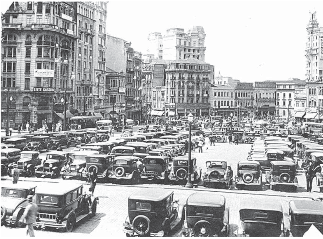
1930年代中頃、聖市セントロのセー大聖堂前のラルド・ダ・セー(現在のセー広場、『在伯同胞活動実況写真帳』1938年、竹下写真館)