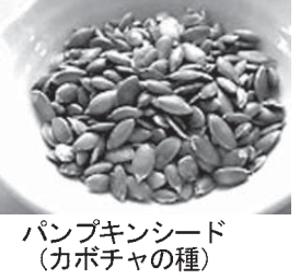
パンパンキンド(カボチャの種)

作り方 (1) こしあん 皿にうすく市販のこしあんをのせ、そのまま電子レンジの強で2分ほど加熱(周りが乾いてくる程度)する。10等分にしておく。 ※カボチャあん カボチャの皮をむき、ひたひたの水で茹で、熱いうちに丁寧につぶす。つぶしたカボチャに、砂糖、スキムミルクを入れて混ぜ、弱火にかける。水分がなくなつて、まわりがからかなくなるまで火を入れる。キツチンペーパーなどにのせ、表面が乾いたら、目をや耳をつける。金串で焼く。 (2) ボウルに白玉粉と上新粉を加え、水を半分入れよく混ぜる。混ぜたら、砂糖を加え、それぞれ好みのあんを包み込み、うさぎの顔になるようにさらに整える。たつぷりの湯で、浮き上がってくるまでゆでる。キツチンペーパーなどにのせ、表面が乾いたら、目をや耳をつける。金串で焼く。 (3) (2)でこしあん、カボチャあん、それぞれ好みのあんを包み込み、うさぎの顔になるようにさらに整える。たつぷりの湯で、浮き上がってくるまでゆでる。キツチンペーパーなどにのせ、表面が乾いたら、目をや耳をつける。金串で焼く。 ※カボチャあん カボチャの皮をむき、ひたひたの水で茹で、熱いうちに丁寧につぶす。つぶしたカボチャに、砂糖、スキムミルクを入れて混ぜ、弱火にかける。水分がなくなつて、まわりがからかなくなるまで火を入れる。キツチンペーパーなどにのせ、表面が乾いたら、目をや耳をつける。金串で焼く。