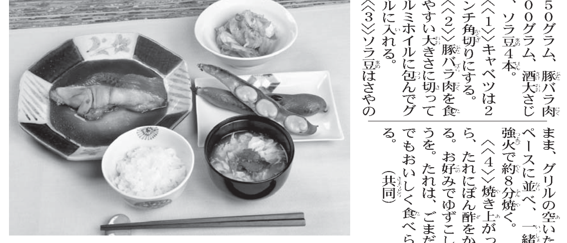
和食=金目鯛の煮付けなど

和食レシピ 金目鯛の煮付けなど 【金目鯛の煮付け】4人分 金目鯛の切り身 4切れ、シヨウガの薄切り 4切れ、木の芽を適量、酒と水各200cc、しょうゆとみりん各大さじ3、砂糖大さじ1を入れて、煮沸した湯にくぐらして霜降りにした金目鯛、シヨウガの薄切りを入れて落とす。強火で加熱。 ①煮立ったら中火にして約10分煮る。 ②だし汁を温め、水溶きかたくり粉を入れ、とろみが付いたら溶き卵を流し入れる。 ③仕上げに三ツ葉をのせる。 【白米】4人分 米を洗って30分以上水に浸して、水でかき流す。できあがりになるまで蒸らす。 【豚バラ肉】2センチ角に切る。 ①豚バラ肉を2センチ角に切る。 ②鍋に入れて適量の水を張りふたをして強火で煮沸し、2分ほど炊いたら火を弱め、約10分火にかける。 ③火を止め、さらに約10分蒸らす。 【キャベツと豚バラ肉のホル焼き、グリルソラ豆】4人分 キャベツ、豚バラ肉、ソラ豆、塩、薄口しょうゆ、酒、水、しょうゆ、みりん、砂糖、しょうが、金目鯛、シヨウガ、木の芽、三ツ葉、かたくり粉、溶き卵、だし汁、水溶きかたくり粉、仕上げに三ツ葉。