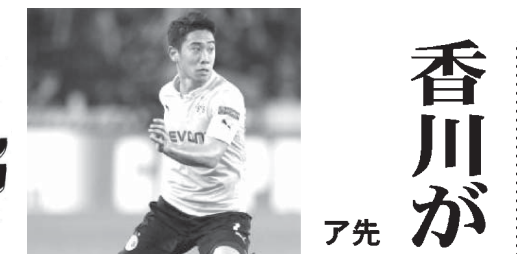
香川がフル出場に貢献

内村や白井ら調整 世界中国・南寧できよう開幕 【南寧(中国)共同】体操の世界選手権は3日、中国の南寧で開幕する。2日は男女の日本代表が調整し、4日に予選を控える男子は練習会場