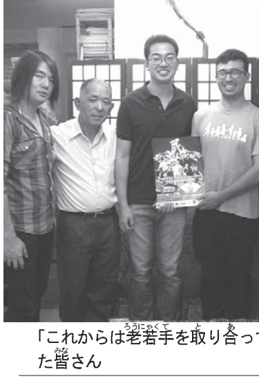
「これからは老若手を取り合って!」と来社した皆さん