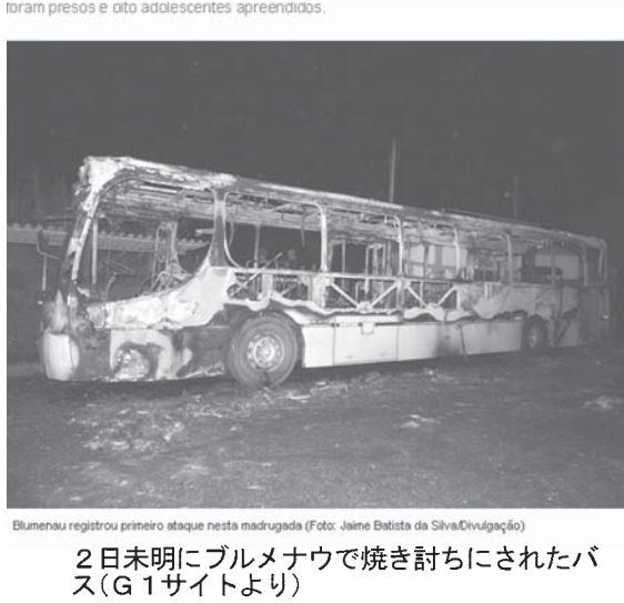
2日未明にブルメナウで焼き討ちにされたバス

その他の犯罪撲滅作戦の拡大阻止と、警察との抗争で死亡した仲間の報復を目的として起こした犯罪と見ている。9月26日以降繰り返されてきたのは、バスの焼き討ちや警察署襲撃、警官や刑務所職員などの治安関係の公務員の自宅襲撃などで、ガソリンスタンドの放火未遂も含まれる。軍警は2日、26日