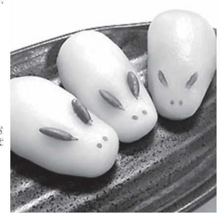
カボチャあんの「お月見うさぎ団子」