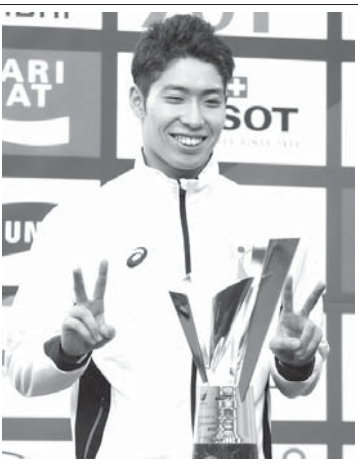
仁川アジア大会の最優秀選手に選ばれ、金メダル4個獲得のポスチン選手

【仁川共同】45カ国・地域から1万人近い選手が参加した第17回アジア大会は4日夜、韓国・仁川で閉会式を行い、16日間のスポーツの祭典が幕を閉じた。日本選手団は競泳男子で4