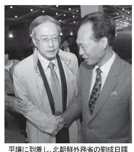
平壤に到着し、北朝鮮外務省の劉成日課長(右)の出迎えを受ける外務省の伊藤純一アジア大洋州局長(左)ら(共同)

【平壤共同】外務省の伊藤純一アジア大洋州局長を団長とする政府代表団は、拉致被害者12人の安全情報を北朝鮮関係者から聴取するために27日午後、經由地の北京から空路で平壤入りした。日朝合意に基づく「全ての日本人に関する調査」を行う特別調査委員会と28、29両日に協議、拉致問題の再調査に最優先で取り組むよう求め、解決への糸口を探る。