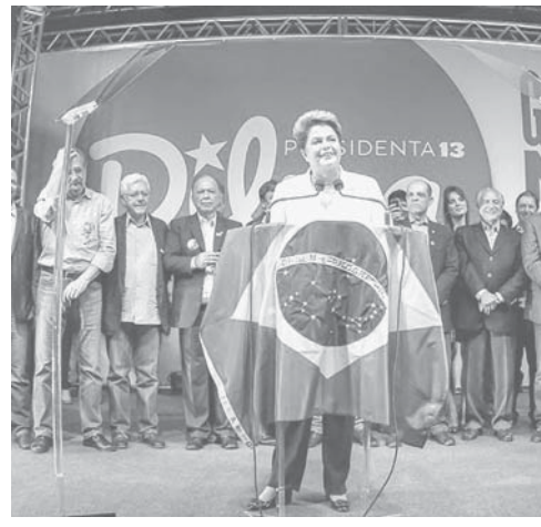
大統領再選を果たしたジウマ氏 (Dilma Rousseff)

数日前までの世論調査では、53.5%の支持率でジウマ氏有利と言われていたが、ジウマ氏にとって予断を許せる状況ではなかった。それは24日に発表されたウエーパ紙が「ベロプラサ贈収賄疑惑」に関してルーラ前大統領もジウマ氏も知っていたと題して表紙にしたため、メンサロン事件を最初世に知らしめた同誌の報道というところもある。ジウマ氏は選挙高等裁判所に差し止めを求めたものの行動もとった。