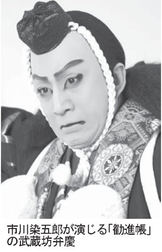
市川染五郎が演じる「勸進帳」の市川武蔵坊弁慶

【共同】11月の東京・歌舞伎座 吉例顔見世で、歌舞伎役者の十八番「勸進帳」の武蔵坊弁慶に初めて挑む市川染五郎。「弁慶に憧れ続けた」と語る染五郎は、歌舞伎の魅力を伝えるべく、この役を演じた。