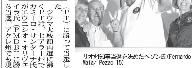
リオ州知事当選を決めたペゾン氏

マルコーニ・ペリーロ氏（PT）に勝って当選した。アエシオ・ネウエス氏（PSDB）が現職のペゾン氏（PPS）に勝って再選。南マツト・グロッセッティはレイナウ・アザンブール氏が現職のペゾン氏（PPS）に勝って再選。南マツト・グロッセッティはレイナウ・アザンブール氏が現職のペゾン氏（PPS）に勝って再選。