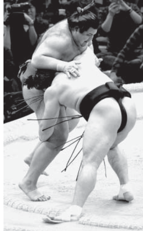
日馬富士（手前）が勇み足で高安に敗れる

【共同】大相撲九州場は目録星獲得。横綱白鵬は右すくい投げで逆転勝ちし、横綱鶴竜は安美錦を押し出し、と