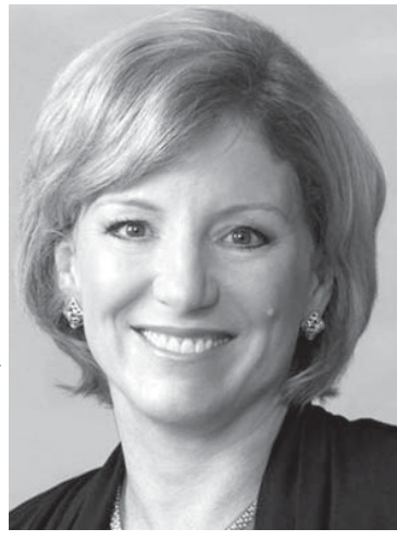
エイボンのシェリ・マッコイ社長

化粧品業界は目を転じて、大手のエイボンとナトゥーラが2014年第3四半期（7-9月）に売上をそれぞれ、前年同月比マイナス5%とマイナス15%という水準で下落させた。エイボンのシェリ・マッコイ社長によると、