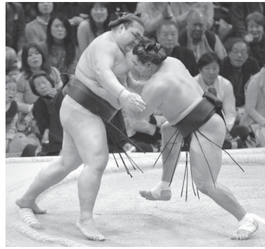
日馬富士が押し出しで稀勢の里(左)を下す

出陣から危ぶまれた場所前の状況からは想像できないような、日馬富士の見事な攻めだった。一方稀勢の里は押し出しで勝ち越しを決めた。強気が身の上の横綱は「正直、ほっとした。2カ月近くも土俵に上がらなかったわけだから」と言葉をかみしめた。 素早い立ち合いから突き刺すような左喉輪。自分より34キロ重い大関を起すこと、頭を相手の頸の下に入れながら腹を押し、勝負をつけた。魅力が詰まった3秒弱に、いつも立ち合いに集中している。感覚が戻った右目周辺を骨折した。場所5日目から休んだ。そこからの復活劇は、細身の体を最高位へ駆け上った道程と重なる。頭から当たる激さが生命線だけに、けがの影響が心配された。稽古不足もあり、関係者による