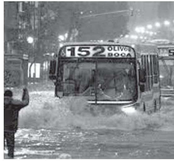
アルゼンチンの雨の風景

ブラジル同様にアルゼンチンでも、2014/15農年の大豆の作付けに遅れが生じている。ただし、干ばつの影響を受けたブラジルと異なり、アルゼンチンでは長雨が原因である。 11月6日までの1週間で、想定面積に対して播種済みのエリアはわずかに1.2%ポイント増加した。2.5%ポイント下回るだけで、過去5農年の平均と比較すると8%ポイントも下回る。 市場関係者によると、「ブエノスアイレスの北部の広い範囲で過剰な雨量が計測されており、天候が回復すれば再播種することになりそう」と言っている。 アルゼンチン国内の大豆播種が終了した状態。