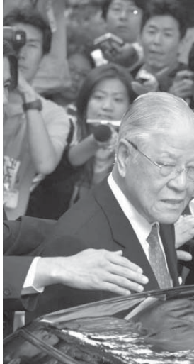
靖国神社参拝を終え、車に乗り込む台湾の李登輝前総統。2007年6月7日午前10時40分、東京、九段北

「かつてのような智慧と勇気に溢れる日本という国を取り戻せ」と、日本人を激励していると思いませんか。「2」