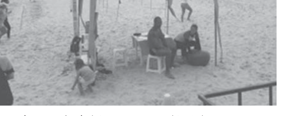
ビーチにもビジネスチャンスがたくさん

ナリのようなことをしているらしい。勝手にテントを建てているのではと、役所に聞いてみたところ、ちゃんと届け出ている。役所の担当者が認めたところだけに許可を与えているとのこと。 では、スペース費はいくらか聞いたところ、なんと無料で貸しているらしい。サービス会社に連絡すると、おおよそ月に50レアル（2250円）から100レアル（4500円）を取って、トレーニングメニュー作りや、簡単なレンタルの商売を自分でやっていた方が実入りが良いので、そちらに行ってしまうらしい。