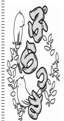
ある日系社会をもっと有効利用するには

外交樹立120周年記念事業は、人の交流を主体としてほしい。日本とブラジルは、移民の始まる18年前の1886年に修好条約が締結されている。来年の2015年には120周年の記念の年となる。現在、日系の新聞社は2社あるが、日本語を認める人が減り、読者減による経営の危機に立たされていると聞く。一世移民が未だ4万人ほど生