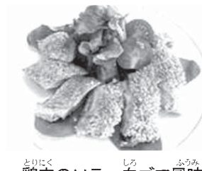
鶏肉のソテー白ゴマ風味

「鶏肉のソテー白ゴマ風味」 材料(2人分) 鶏もも肉250グラム 卵1個 みそ25グラム ミニトマト2個 カイワレ大根 サラダホウレンソウ サニーレタス各適量 作り方 (1)鶏もも肉を開いて筋を切る。塩、コショウをして両面に小麦粉を軽くまぶし、皮の方に溶き卵をつけてみそを塗る。 (2)鶏肉を並べて、ドレッシングであえた野菜をのせ、ミニトマトの半切りとカイワレ大根を飾る。 調理のコツ 鶏肉の周りに好みのドレッシングとパルメザンチーズをかけてもいい。