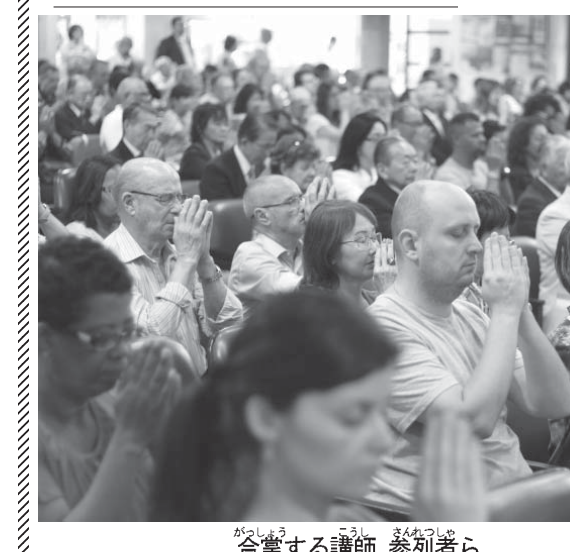
合掌する講師、参列者ら

「ホルトゲースは小学校4年まで」と謙遜するが、伝えたい内容はしっかり説明する。伯人従業員は、「子ども会をきつかけに入会し、現在ダさんは、子ども会をきつかけに入会し、現在