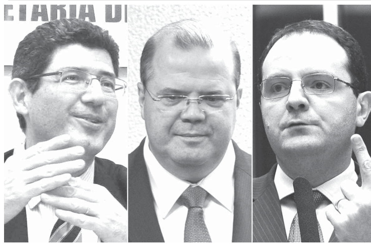
レヴィ次期財相、トロンビニ中銀総裁、バルボザ次期企画相

▼財務大臣ジウマキン・レイ (Joaquim Levy) リオ出身、53歳、リオ連邦大学工学、経済学部卒、米シカゴ大学院卒、経済学教授。92年 IMF (国際通貨基金) IDB (米州開発銀行) などの役員。2000年財務省企画官、国庫要職。2007年リオ財務長官、2010年ブラデスコ系列社専務、財務省主税局長。長時は冗費カットに厳しく (Mr. No Taxation) ミスター・カット) と言われた。仕事ぶりは猛烈で昼夜ブツ通し、仕事場のソファで仮眠の勤務をし、そのため、昼夜分担の3人の秘書を置いて、周りを引き回す実行力とあわせ (TRATOR II プルダザ) とあだ名をつけられた。 ▼企画予算大臣ネルソン・バルボザ (Nelson Barbosa de Souza) リオ生まれ、45歳、リオ連邦大学経済、米ニューヨーク社会科学研究大学院卒、財務省政策局長、企画大臣付。BNDES (開発銀行、中央銀行) 発、銀行、中央銀行、ヴァーリ社要職歴任、大学教授。身長190センチの大男で、大学時代はボートの選手。PT政 権では各種重要政策立案遂行に腕を振った。 ▼中央銀行総裁アレシャンドレ・トロンビニ (Alexandre Tombini) ポルト・アレグレ出身、51歳、ブラジリア大、米イリノイ大学卒、ブラジル中央銀行各役、11年から中央銀行総裁 (今回再任)。貨幣価値の維持 (インフレ率進防止) に尽力し、公的勘定の均衡、金利、為替などを管轄する。 このように経済運営を任される3人は専門の知識経験とも豊富で、油の乗り切った働き盛りです。相模並みの体格で押し出しも立派、海千山千の政治家との応接、外国機関との折衝なども引けとりません。ところでブラジル内外の金融界、産業界などの今回人事への評価も上々でした。ジウマ第二期政権の順調な第一歩でしょう。 勘定を正し健全財政をこの3人のエコノミストたちは、今までのマンテガ財務省の人達と業務のすり合わせ、新政策の協議などを行っているところ、まだ正式にその