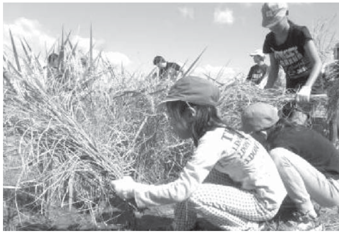
実った「奇跡の復興米」の稲刈りをする小学生=大阪府富田林市