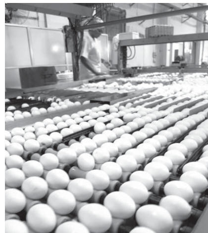
最新の選別機、梱包機が備えられた工場設備を流れる卵

の雛を買ってきて、120日間ほど育てる大事な場所だ。建物外に蒸気機関のようなボイラーがある。成長したら別の場所に立てられた成鶏舎に移して、そこで10日余りすると産卵を始め、約2年間で産卵する。10万羽収容の近代的な成鶏舎は20棟ほどずらりと並ぶ。無数の鶏の鳴き声と機械が動く音だけが響く。それでも450人の従業員がいる。