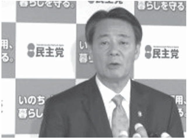
衆院選のマニフェスト（政権公約）を発表した民主党の海江田万里代表

【共同】民主党の海江田万里代表は24日、党本部で記者会見し、衆院選のマニフェスト（政権公約）を発表した。消費税率引き上げを延期するとした上で、複数税率や、低所得者対策として減税と現金支給を組み合わせた「給付付き税額控除」の導入を検討すると明記した。安倍政権の経済政策「アベノミクス」は国民生活を悪化させ、格差を固定化・拡大させた