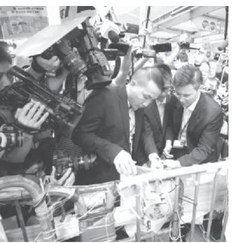
香港・九龍地区のモンコックで、裁判所の占拠禁止命令書を張る執行官ら

【香港共同】大規模デモが続く香港の司法当局は24日、学生らが占拠する九龍地区の繁華街モンコック（旺角）で、学生らが設置した鉄柵やバリケード撤去に向けた作業を完了させた。香港メディアによると、当局は早ければ25日に強制執行に着手する構えだ。