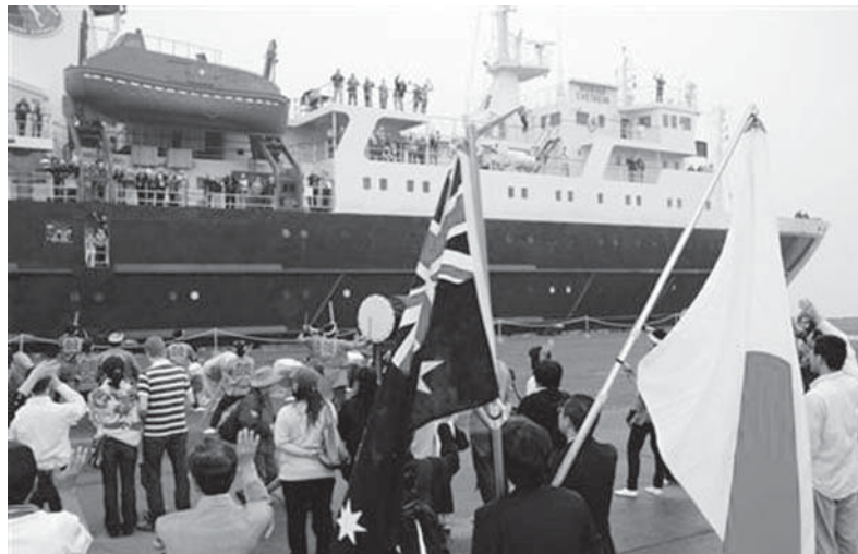
北海道・釧路港から北方領土へ向け出港するクルーズ船=2008年

「パスポート」ロボットのようには表情のない、小太りの若い白人金髪女性が言った。恐る恐るパスポートを差し出す。あっさり入国を拒否されてしまいうる。不安がよぎる。