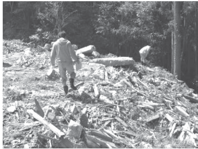
山林に不法投棄された廃棄物

【共同】茨城県は、警察が捜査中であり現場を捜査しない」としているが、不法投棄の監視や環境保全への対応が問われそう