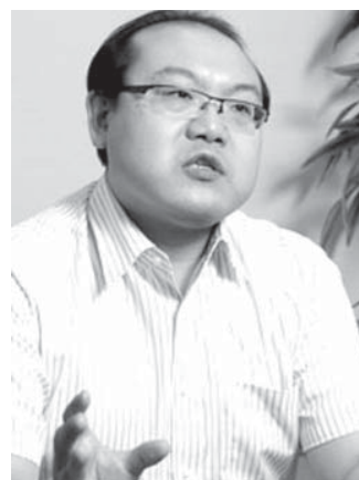
らをの迫鐘所員を警衛主任研究員として、安倍首相が就任から約2カ月後にオバマ米大統領と会談し「聖域なき関税撤廃が前提ではないことが明確になった」と判断した。

【共同】安倍首相は、通商政策を成長戦略の柱に据え、環太平洋連携協定（TPP）などの交渉にまい進してきた。経済界は輸出を後押しする貿易自由化策を歓迎するが、交渉では相手国から農産品の関税削減を求められるなど、農産物の輸出に打撃を受ける懸念もある。