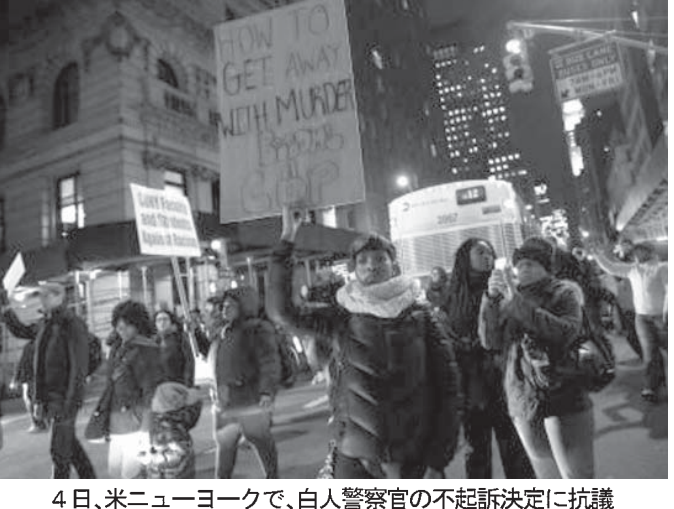
4日、米ニューヨークで、白人警察官の不起訴決定に抗議するデモ隊

【ニューヨーク共同】違法なたばこを売った疑いのある黒人男性の首を絞めて路上に引き倒し、死亡させたニューヨーク市警の白人警察官の不起訴決定に反発する抗議デモは4日夜もニューヨークはじめ各地で起き、連夜の全米規模の抗議行動となった。3日夜より規模が拡大し、参加者は計数千人に上った。丸腰の黒人青年が白人警察官に射殺されたミネソタ州ファーガソンの事件と合わせ、黒人に対する警察の差別的、横暴な姿勢に市民の怒りが噴出している。