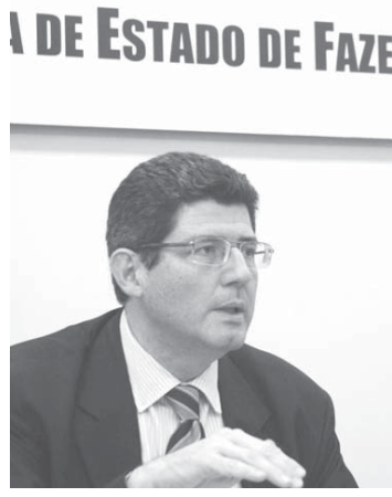
ジョアキン・レヴィ次期財務相

連邦政府の新しい経済スタンプ発表から約1週間後、連邦政府が15年17年の経済指数の予測を発表した。その数字は現在のスタンプが出したもののより低く、より現実的なものとなった。15年のGDPの予測は、4月時点での連邦予算基本法（LDO）や8月に提出された15年度