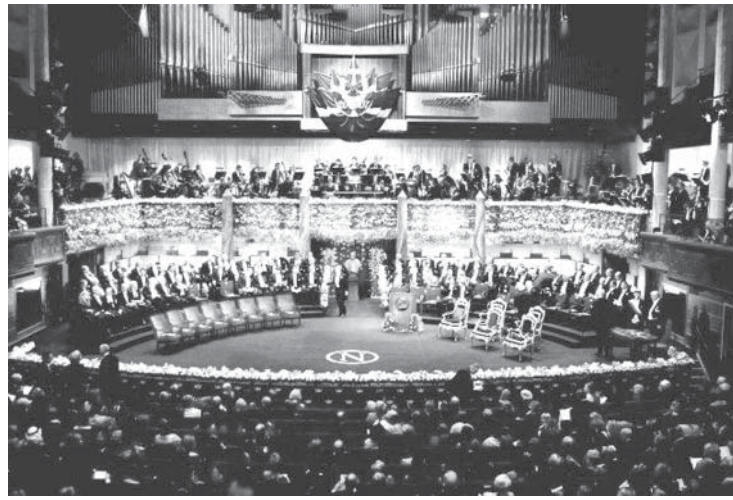
ノーベル賞授賞式会場である市庁舎ブルーホール