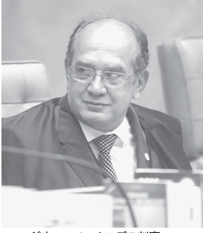
ジウマル・メンデス判事

機を使った費用310万レアルが還付されたと見られるが、「献金者の名義の不正や受け取った献金の登録漏れ、領収書の不一致など、PTが8万7千4300レアルを支払ったサンタカタリーナ州フロリアノポリスの企業UMTIが選挙キャンペーン開始後に領収書を切る資格を得た」などと、16人の監査官が作成した報告書で、PTの報告書では収入で18%、支出で10%の不正が認められた。PTは驚きを隠さず、「提出期限を守っているが、提出期限を過ぎていないものがある」と指摘している。同日中にTSEで裁判が行われる。その際の報告官はメンデス判事と、同判事が最初の投票者となる。