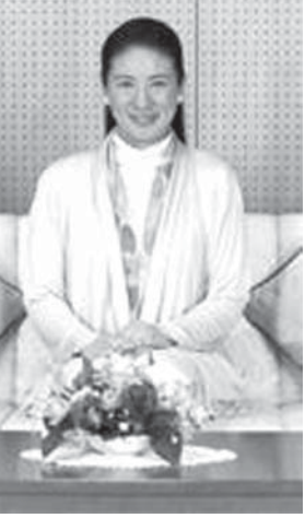
51歳の誕生日を迎えられた皇太子妃雅子さま

【共同】皇太子妃雅子さまは9日、51歳の誕生日を迎えられた。宮内庁東宮職を通じて文書で感想を発表し、来年の戦後70年について「先の