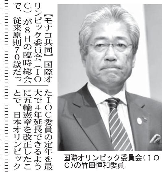
国際オリンピック委員会（IOC）の竹田恒和委員

【共同】2020年東京五輪での実施へ道が開けた競技の関係者には歓迎ムードが広がっている。採用に向けて一層の努力を誓う声が上がった。日本では注目度が高い野球、ソフトボールは有力候補とみられ、日本野球連盟（NPB）の熊崎勝彦（クマザカシヨノ）が「復活の可能性が高まったのは大変喜ばしい。復帰実現に向けてできる限り