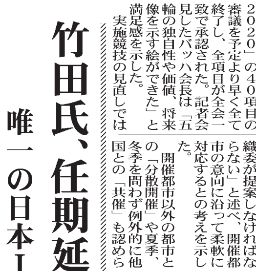
国際オリンピック委員会（IOC）の竹田恒和委員

【共同】国際オリンピック委員会（IOC）の竹田恒和委員は、8日の臨時総会で、中期改革「五輪アジェンダ2020」の40項目を満場一致で可決させた。竹田委員は「重要な意味がある」と強調し、日本オリンピック委員会（JOC）の竹田恒和会長は「暖かな部分を残して柔軟性を持たせるのがバツハ流」と評した。