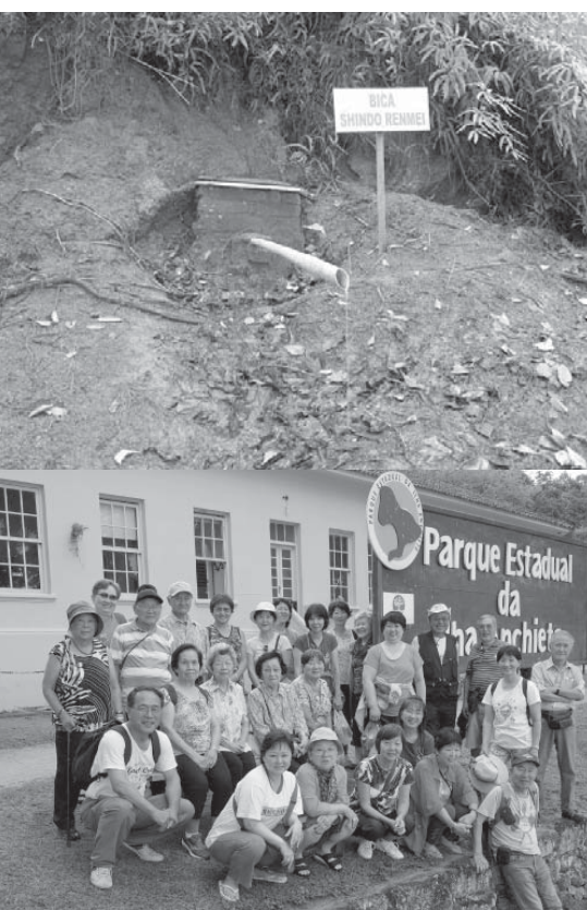
「臣道聯盟の蛇口」(Bica Shindo Remeio)と名付けられた水源地／リベルターデ歩こう会の訪問