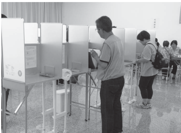
聖市の投票所、援助には601人が投票に訪れた

全伯における投票数はレシフェ、マナウスを除く6在外公館で減少、前衆院選より246票下回った。伯国内で在留邦人の最も多いサンパウロでは、在外選挙人登録者約1万2000人超のうち、601人が投票所へ赴いた。2012年であった「第46回衆院選」の784票を183票下回る結果となった。