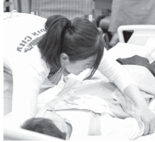
介護職員の賃金は月額1万円程度引き上げられる

【共同】政府は15年度、介護報酬を原則3年に1度改定され、15年度予算編成の焦点の一つ。厚生労働省が今年3月の介護事業所の経営状況を調べたところ、特養の利益率は8.7%、通所介護(デイサービス)は10.6%だった。財務省は、他産業よりも利益率が高い上、特養に比べて約2兆円の内部留保があると問題視している。