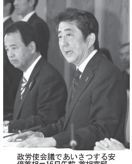
政労使会議で安倍首相と労働大臣

【共同】政府は16日、関係閣僚と経済界、労働団体の代表らによる「政労使会議」を開き、2015年春闘に向け「政府の環境整備の取り組みの下、経済界は賃金の引き上げに向けた最大限の努力を図る」との合意文書をまとめた。アベノミクスの効果を都市部や大企業から地方や中小企業に波及させるため、下請け企業の取引価格の上昇を促すことも盛り込んだ。