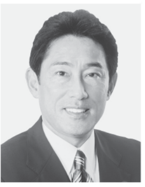
外務大臣 岸田 文雄