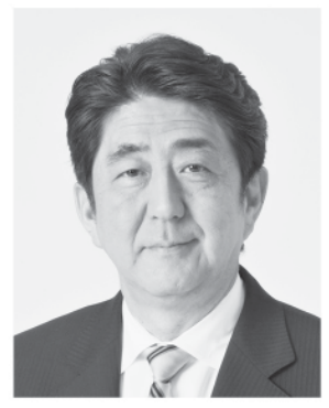
内閣総理大臣 安倍 晋三