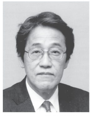
在ブラジル日本国大使館 全権大使 梅田 邦夫