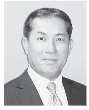
在サンパウロ日本国総領事館 総領事 福嶋 教輝