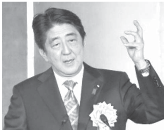
経済3団体の新年祝賀会であいさつする安倍首相

【共同】原油価格の急落や欧州経済の不安再燃により、年初から株式市場の大揺れが続いている。企業トップも国内外の景気動向への警戒を強める。混乱が広がれば、安倍政権が目指す賃上げを前提とした「好循環」が遠のく恐れも否定できない。