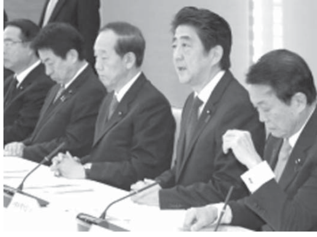
宇宙開発戦略本部の会合であいさつする安倍首相(右から2人目)、その奥は山口宇宙相

【共同】政府の宇宙開発戦略本部(本部長・安倍晋三首相)は9日、首相官邸で会合を開き、宇宙安全保障の確保を政策の重点課題に掲げた新たな「宇宙基本計画」を正式決定した。宇宙に関わる今後10年間の政策の方向性を定めた長期計画。宇宙関連産業を今後10年間で計5兆円規模に拡大することも盛り込み、これまでの計画よりも安全保障と産業利用に二層の重点を置いたのが特徴だ。