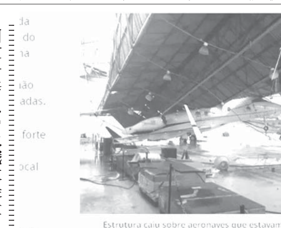
Estutura caiu sobre aeronaves que estavam estacionadas no hangar.

シウシヤだが、強い関心を持っているとされている。レコルデ局は、シウシヤを従来の「ミイラ」から、「芸能人」へとトーンアップするのを目指している。グループの番組でも既に同様な方向性を示している。シャリッタが、彼女の最終的な選択はやかま。