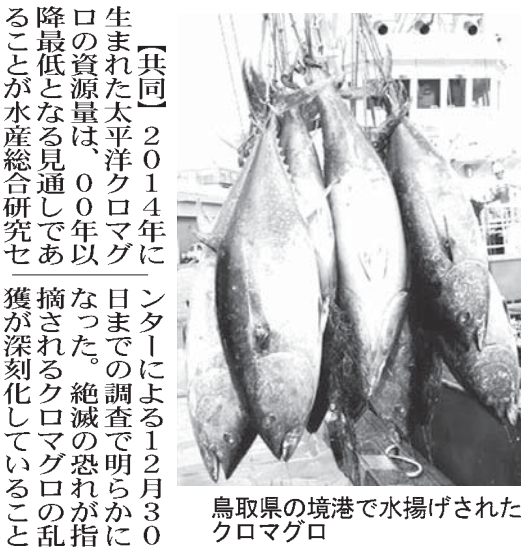
鳥取県の港で水揚げされたクロマグロ

【共同】2014年に生まれた太平洋クロマグロの資源量は、00年以降最低となる見通しであることが水産総合研究センターによる12月30日までの調査で明らかになった。絶滅の恐れが指摘されるクロマグロの乱獲が深刻化していること