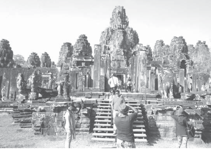
観光客でにぎわうアンコールワット

東京・サンパウロ・リオ ビジネスの現場から 〜日伯コンサル 審判日記〜 (第12回)