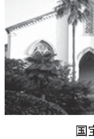
国宝の大浦天主堂

【共同】政府は16日の閣議で「長崎の教会群」とリスト教関連遺産として長崎県を世界遺産に推薦することを閣議了解した。今月末に国連教育科学文化機関(ユネスコ)へ推薦書を提出する。ユネスコの諮問機関が9月に現地調査を行う。来年度の世界遺産委員会で登録の可否が審査される。