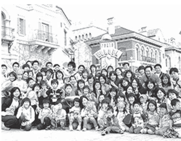
児童養護施設で暮らす子どもたち。このうち59.5%が親などから虐待を受けた経験があるという