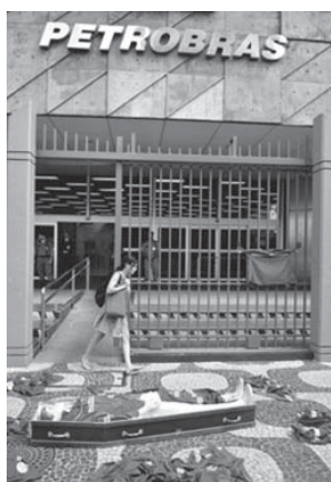
PBを巡る汚職は連邦警察が昨年3月に開始したラヴァ・ジャット作戦(LJ)の進展に伴い、当初の報道を上回る規模に拡大しているが、その実態が明らかになるのと並行してPBと関連企業の事業はますます停滞。雇用縮小や給与低下、契約の見直しといった報道が次々に流れている。LJに関与した企業や

PB職員の対象とする公判が行われている。PB連邦地裁では、被告の供述を行った被告の他の証人の証言が13日まで続き、元サビピ部長がPB内の基準を無視して事業契約を締結するよう仕向けた事などを含む、より具体的な情報も明らかになってきた。一方、PBは国外の監査会社が汚職に伴う損失