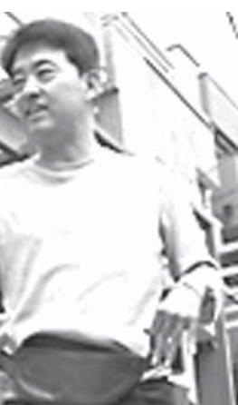
「装い支援」で男性も元気。脳卒中で体の片側がまひし、家に引きこもりがちだった東京のある男性は、片手で扱える、フックも高い服やバッグを使うことで生活が変わり、体力や気力の回復を実感した。関わった専門家は「装いが回復への力になることは男性も同じ。そうした意識が社会に広がってほしい」と話す。