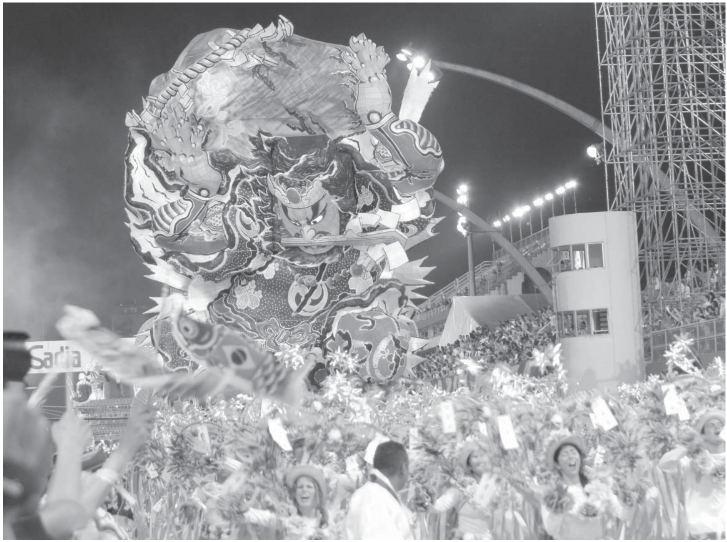
3500人の大行進のしんがり近く、4台目の山車に乗って勇壮に登場したたちねぶた「鹿島大明神と巨大鯉」