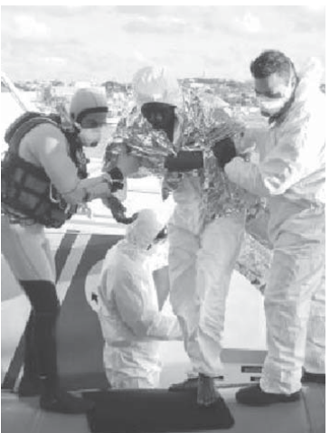
難破した船から救助された移民、イタリア沖の地中海で、大型豪華客船「コスタ・コンコルディア」が座礁して横倒した

【ジュネーブ共同】国連難民高等弁務官事務所(UNHCR)は11日、北アフリカのリビアからボートで欧州を目指していた移民ら約300人が、イタリア沖の地中海で行方不明になったと発表した。ANSA通信は少なくとも330人が死亡したと報道。UNHCRは「大きな悲劇に衝撃を受けて」とコメントを発表した。 UNHCRによると、行方不明者の大半はサハラ以南のアフリカから来た移民と見られる。イタリア沖の地中海で、約300人が行方不明になったと発表した。ANSA通信は少なくとも330人が死亡したと報道。UNHCRは「大きな悲劇に衝撃を受けて」とコメントを発表した。