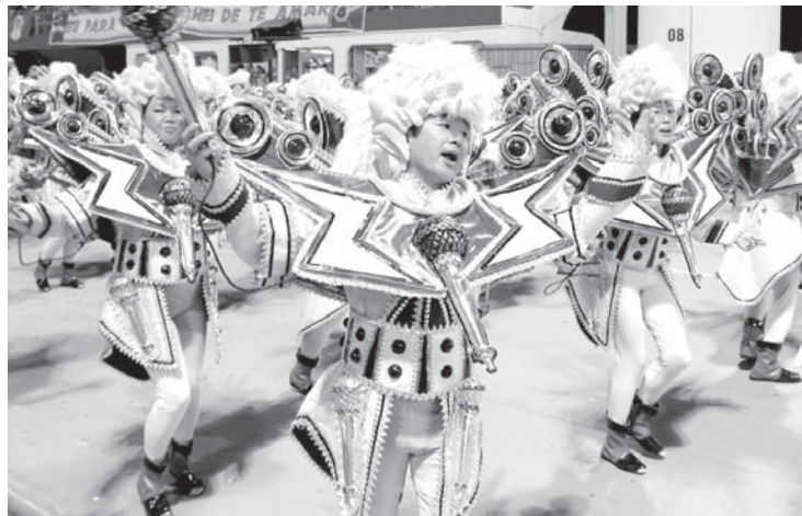
特に日系人が大挙して参加したカラオケのアーラの様子