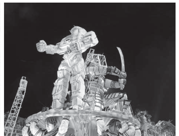
若者に人気の特撮風の巨大ロボットも山車の上に登場!