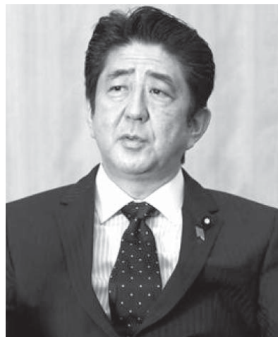
「改革断行」を掲げ、政策実現への決意を強調した安倍晋三首相

【共同】安倍晋三首相は12日の施政方針演説で「改革断行」を掲げ、政策実現への決意を強調した。「悲願」達成に意欲を示す安全保障法制の整備や憲法改正をめぐっては、2015年度予算の成立に向けて「深入り」を避けた。(官邸筋)形 「共同」安倍晋三首相は12日の施政方針演説で「改革断行」を掲げ、政策実現への決意を強調した。「悲願」達成に意欲を示す安全保障法制の整備や憲法改正をめぐっては、2015年度予算の成立に向けて「深入り」を避けた。(官邸筋)形