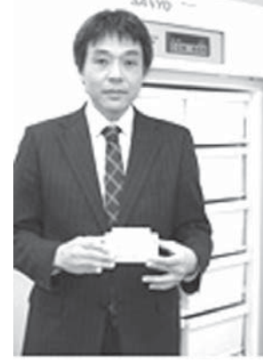
約1300の既存薬を保管してあるサンノボ島

【共同】ある病気の治療に使われる既存の薬が、別の病気に有効だと分かることがある。従来は偶然や幸運に頼っていた。その発見を、新薬開発の手法として戦略的に進めようとする研究が活発になってきた。画期的な新薬の登場が減る中、患者への使用実績がある既存薬は、安全性や開発コスト面で利点が多い。国も研究支援に乗り出している。