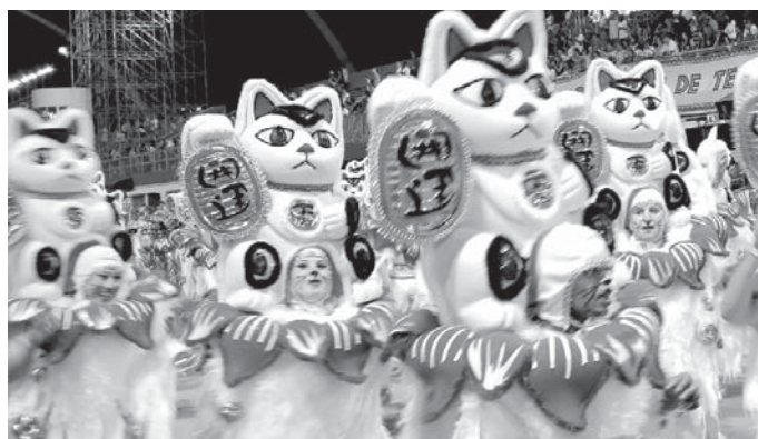
招き猫をモチーフにした衣装も