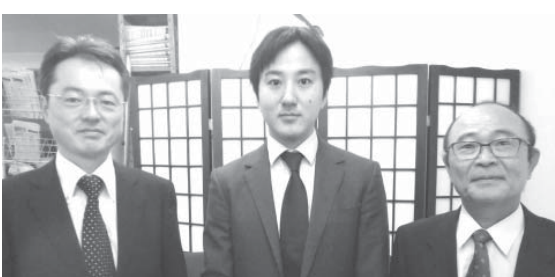
寺本企画副委員長、知屋城総務委員、平田事務局長