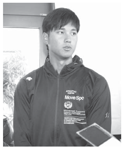
開幕投手を務めることが決まり、記者の質問に答える日本ハム・大谷