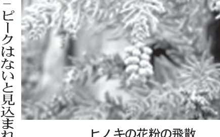
ヒノキの花粉の飛散

【共同】スギやヒノキの花粉の飛散が、2月下旬から各地でピークを迎える。福岡が2月下旬、3月上旬と予想。 その後は、東京や名古屋、大阪、広島、高松が3月上旬、仙台と金沢が3月中旬、下関と北上が3月下旬と予想。 スギ花粉の後は、4月中旬にかけてヒノキ花粉が飛散するが、仙台と金