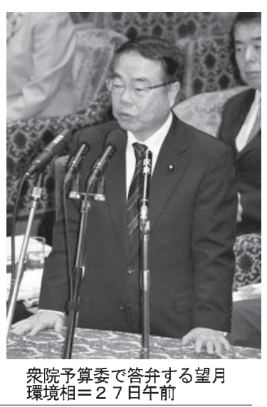
望月義夫環境相と上川陽子法相がそれぞれ代表を務める政党支部が2013年、国土交通省と環境省の補助金交付が済んでいた静岡県清水区の物流会社「鈴与」から計200万円の寄付を受けていたことが27日、分かった。

【共同】望月義夫環境相と上川陽子法相がそれぞれ代表を務める政党支部が2013年、国土交通省と環境省の補助金交付が済んでいた静岡県清水区の物流会社「鈴与」から計200万円の寄付を受けていたことが27日、分かった。