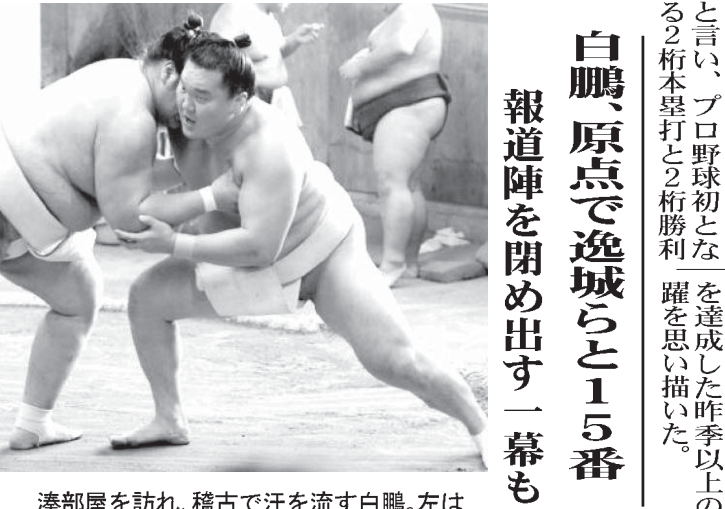
漫部屋を訪れ、稽古で汗を流す白鵬。左は照ノ富士。

【共同】大相撲春場所(3月8日初日)大阪府ボイメーカークコロシアム)で2度目の6連覇を目指す横綱白鵬が27日、大阪府大東市の漫部屋を訪れ、稽古で汗を流す。漫部屋を訪れ、稽古で汗を流す白鵬。左は照ノ富士。 【共同】大相撲春場所(3月8日初日)大阪府ボイメーカークコロシアム)で2度目の6連覇を目指す横綱白鵬が27日、大阪府大東市の漫部屋を訪れ、稽古で汗を流す。漫部屋を訪れ、稽古で汗を流す白鵬。左は照ノ富士。