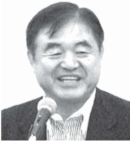
五輪担当相に起用される有力候補、遠藤利明元文部科学副大臣

【共同】政府は20日の閣議で、スポーツ行政を一元的に担うスポーツ庁の設置法案を決定した。2020年東京五輪・パラリンピックの開催準備に当たる専任の担当相を新設するため、閣僚を1人増員して19人にする特別措置法案も決めた。 成立すれば、10月にスポーツ庁を立ち上げ、五輪に向けた選手強化、スポーツを通じた国際貢献に取り組み、初代長官には元アスリートなど民間人を起用する方針。 下村博文文部科学相は閣議後の記者会見で、「今までではなかった」と述べ、スポーツ庁は文科省の外局として設置。同省のスポーツ・青少年局を中心とした運動施設を整備する国土交通省や、健康増進