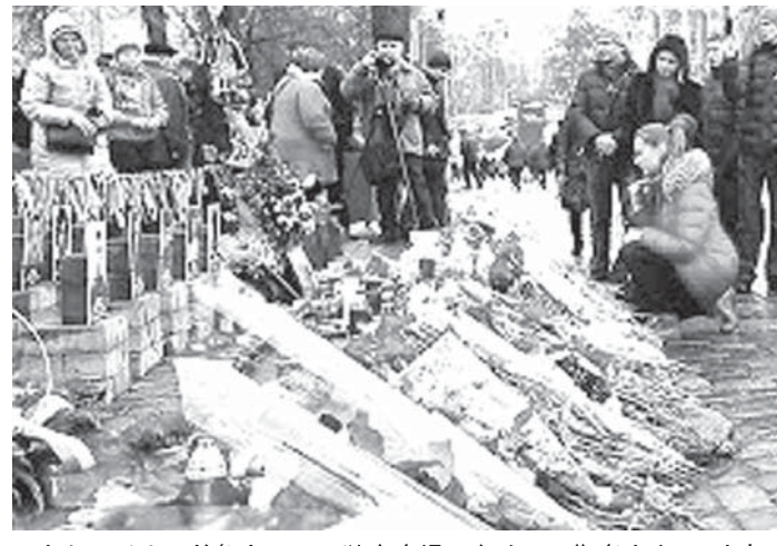
ウクライナの首都キエフの独立広場で多くの死傷者を出し、政変につながった衝突から1年がたった。犠牲者に献花する市民

【共同】政府軍と親ロシア派武装組織との武力紛争で5600人を超す死者を出したウクライナ危機は、その発端となったヤヌコビッチ政権崩壊から23日でも迎えた。2度目の停戦合意発効後も東部の戦闘はやまず、地元住民は将来への不安を隠さない。ロシアのクリミア編入で悪化した欧米とロシアの対立も激しさを増す一方、「新たな冷戦」に出口は見えない。