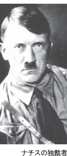
ナチスの独裁者ヒトラー

【ベルリン共同】ドキュメントの独裁者ヒトラーの著書「わが闘争」が、来月1月に再出版される見通しになったと報じた。第2次世界大戦