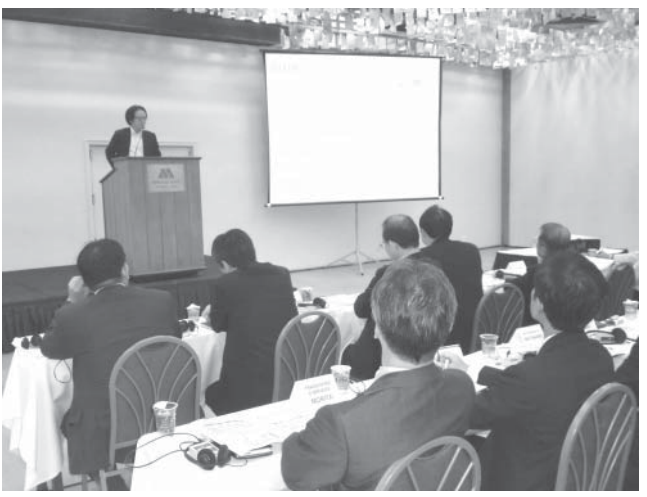
部会長の発表を聞く参加者ら