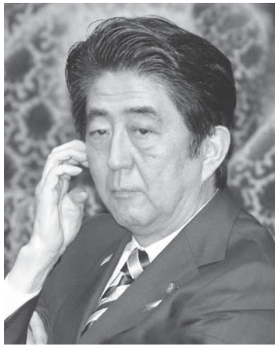
衆院予算委で質問を聞く安倍首相=3日午前

【共同】安倍首相が代表を務める自民党支部が2011〜12年、中小企業庁の補助金交付が決まった大阪市中央区の化学製品卸会社「東西化学産業」から、その1年以内に計24万円の寄付を受けたことが3日までに、政治資金収支報告書などで分かった。