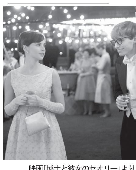
映画「博士と彼女のセオリー」より

【共同】「博士と彼女のセオリー」の主人公が、筋骨痙攣性側索硬化症（ALS）を患い、車いすの天才科学者として知られる英国の物理学者、スティーブン・ホーキング博士。だが彼の偉業をたどる伝記映画ではない。その傍らに深い愛で寄り添った最初の妻、ジェーンがもう一人の主人公だ。映画は2人の愛の軌跡をつづる。1963年、ケンブリッジ大学の大学院で物理学の博士号取得を目指すスティーブンは、中絶するスティーブンを学ばせ、ジェーンと出会う。2人はたちまち恋に落ちるが、スティーブンは余命2年を宣告される。それでもジェーンは共に生きることを決意、2人の人生が始まる。スティーブンの体を支えるのはジェーン。ジェーンは「本から2本、そして車いす。そして声も失う。身体機能が衰えていく中でも、スティーブンを支える。家族を慈しむ天才に成り切った工