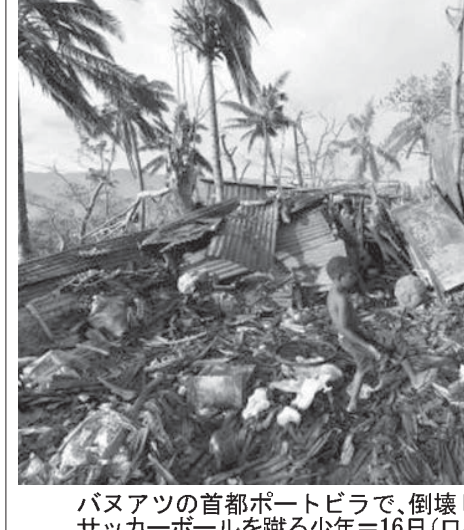
バヌアツの首都ポートビラで、破壊された家屋付近でサッカーボールを蹴る少年＝16日（ロイター＝共同）

【シドニー共同】大型サイクロンが直撃した南太平洋の島国バヌアツの首都ポートビラで支援活動をする国際援助団体は16日、離島の救助が遅れている間、数万人が支援が届かない状態に置かれ、衛生状態の悪化も懸念されている。サイクロン直撃を受けたバヌアツの首都ポートビラでは、民間で救援物資が届き、民間機の運航も16日に一部再開。支援が本格化している。現地援助関係者は「オーストラリアのメディアに対し、物資をポートビラがあるエリアに送る以外の島に送る手段がない」と嘆息。サイクロンではポートビラなど大きな被害を受けた。