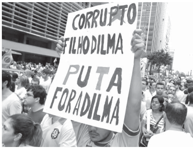
「Corrupto」のPT部分を強調し、反労働者党をアピール