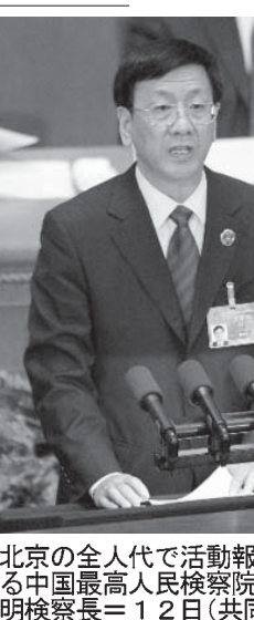
曹建明検察長（右）が12日、北京で開かれた全国人民代表大会（全人代）の会場で、14年間の活動報告を行った。

【共同】26年前に東京都江東区で発見された男性の遺体を警視庁が別の人と取り違え、無関係の女性に遺骨を引き渡していたことが12日、警視庁への取材で分かった。昨年になって遺体の身元とされた当時40代の男性が生存していることが判明し、警視庁は女性に謝罪した。遺体の身元は不明で、警視庁があらためて確認を進めている。1989年12月、江東区の公園内で身元不明の男性の遺体が見つかった。目撃者が居たにもかかわらず、司法解剖で病死と判明。捜査の結果、90年1月ごろに夫の外出先で遺骨を出した女性に遺骨を引渡したと見られる。昨年になって、実際は生きていた夫が生活保護の点に調査すると述べ、引き続き腐敗を厳しく取り締まると表明した。