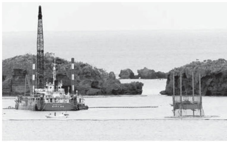
沖繩防衛局は12日、米軍普天間飛行場の移設先、辺野古沿岸部埋め立てに向け、中断していた海底ボーリング調査を再開。移設強行の政府姿勢に地元が反発を強めるのは必至

【共同】政府は米軍普天間飛行場（沖縄県宜野湾市）の移設先、名護市辺野古沿岸部の埋め立てに向け、中断していた海底ボーリング調査を12日、再開した。沖縄県からの再開見合わせ要請を無視し、攻勢を続ける安倍政権、知事に就任してから10日、3カ月となった翁長雄志氏は、辺野古移設阻止へ「あらゆる手法を駆使する」と息巻くが、打つ手は限られ、守勢に立たされているのが実情だ。