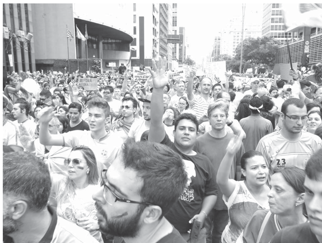
「Fora PT(PT出て行け!)」と連呼する群集