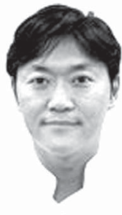
石川大・消化器内科助教

臨床研究ではまず、配偶者か2親等以内の家族に便を提供してもらってこれを生食食塩水と混ぜ合わせ、食物繊維のかすなどを取り除いた後、フィルターでろ過し、滅菌した液体を、内視鏡を使って大腸内に注入する。