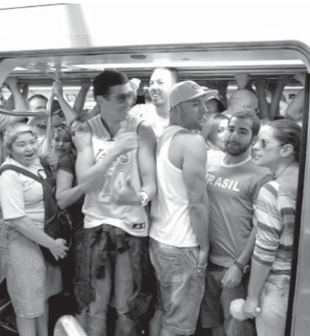
デモに向かう群集で地下鉄車両がいつぱい