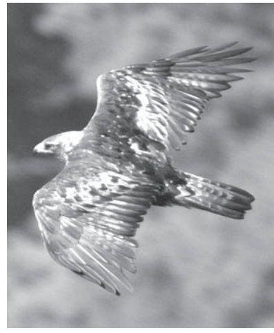
生息数が大幅に減少しているイヌワシ

つがい3分の2に 500羽「存続の危機」 【共同】絶滅危惧種に指定されている大型の猛禽類イヌワシの生息数が大幅に減少し、500羽程度となったことが分かった。調査した日本イヌワシ研究会(事務局 東京)が16日までに明らかにした。過去33年でつがいの数は3分の2となり、繁殖成功率も下がっている。