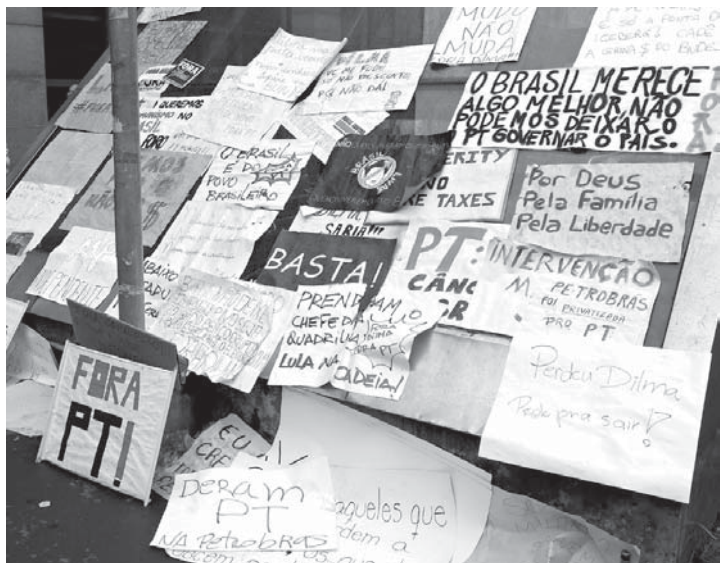
メトロの入り口に貼られたプラカード。中には「軍の干渉」を主張するものまで

ルア元大統領は、白人エリート階級を擁護する黒人青年らに「Fotografia Publica」