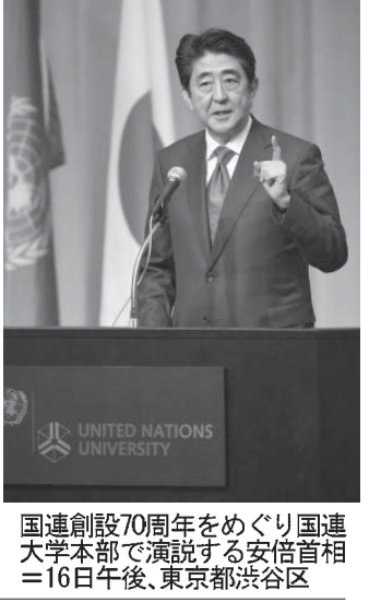
国連創設70周年をめぐり国連大学本部で演説する安倍首相＝16日午後、東京都渋谷区

【共同】安倍首相は16日、国連創設70周年をめぐり国連大学本部（東京）で演説し、戦後日本の取り組みについて「日本は先の大戦に対する深い反省の上に、自由で民主的で人権を守り、法の支配を導く国づくりに励んだ」と述べ、平和国家としての歩みを強調した。国連改革については「もはや議論に時間を割くときではない。具体的な成果を生むべき」として、安全保障理事会常任理事国入りへ意欲を表明した。