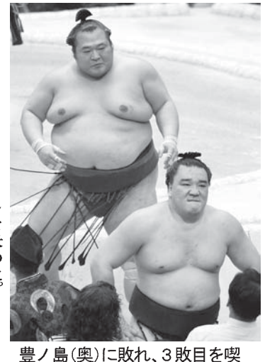
豊ノ島(奥)に敗れ、3敗目を喫した日馬富士

【共同】大相撲春場所 9日目(16日・大阪市ボデーメーカールコシアム)横綱白鵬は泰山を上手で単独トッポを守り続けた。横綱日馬富士は豊ノ島に送り出され、連日の金星配給で3敗目を喫した。豊ノ島は4個目の金星。