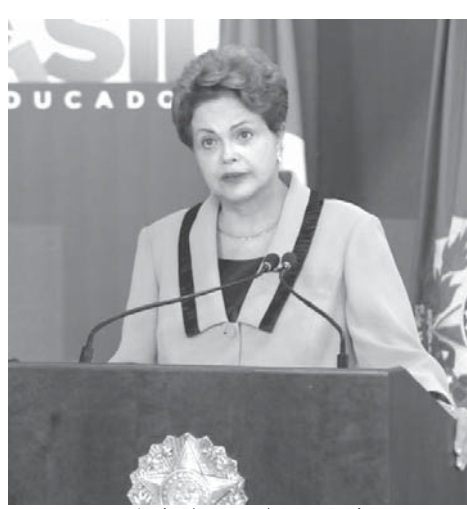
人気急降下のジウマ大統領 (16日)

今回の調査は15日に全国で展開された反ジウマ・デモ後、16日17日に全国2842人を対象に行われたもので、ジウマ政権を「よい」と評する人は、過去最低だった前回の23%を大きく下回る13%に落ち、前回44%まで上がった「悪い」が62%まで急騰した。この数字は、国民直接投票制復活以降の大統領選では、罷免直前のコイロール政権の「よい」9%、「悪い」68%以来の悪い数字だ。これはカルドゾ政権が、デフォルトの危機にあった1999年9月に記録した「悪い」の56%をも上回った。前任のルーラ政権は、メンサロ事件発覚から約半年後の2005年12月に「悪い」を29%記録したに止まっている。