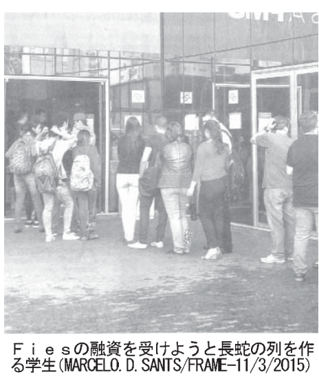
Fiesの融資を受けようとする列を作る学生

むように仕向けた。融資資格の審査にとまらなくなり、多くの失業者が、2010年から14年にかけてのFies利用者数は7万人から190万人に増え、融資額も103倍になったが、03年と09年は年平均5%だった私立大学の増加率に、10年と13年は年