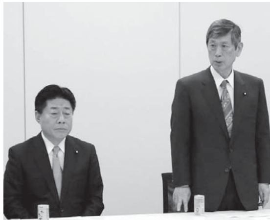
首相安倍晋三（左）と防衛大臣小野寺五典（右）ら。18日午後、衆議院第2議院で閣議が開かれ、安保法制の骨格について実質合意した。

【共同】自民、公明両党は18日、新たな安全保障法制に関する与野協議会を開き、集団的自衛権行使の容認などを踏まえ自衛隊活動を拡大する法制の骨格について実質合意した。