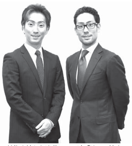
三社祭を控えた浅草での公演「地域の協力に感謝」という中村勘九郎(右)と中村七之助

【共同】江戸の芝居空間を仮設劇場で再現する「平成中村座」が、東京・浅草に帰ってきた。4月1日から5月3日まで開かれる「平成中村座 陽春大歌舞伎 十八世中村勘九郎を偲んで」。急逝した勘九郎の情熱を受け継ぐ長男中村勘九郎と次男七之助が、新生中村座への思いを語った。