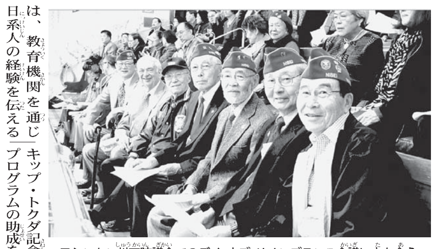
ワシントン州下院議事録でのデイ・オブ・リメンランス会議に立ち会う二世復員軍人会関係者たち

【北米報知】2月26日付け「ワシントン州」の日系人の歴史を振り返る「デイ・オブ・リメンランス」の議決案が州下院で2月19日に可決。当地から足を運んだ二世復員軍人会、日系市民協会、ワシントン州市民協会、ウイングルク博物館の代表者をはじめ、多くの日系関係者が立ち会った。同議案は毎年、日系人強制退去につながった大統領令9066号(戦後補償)活動や政府謝罪につながった連邦法案がワシントン州のロビー活動から始まったことについて触れている。一連の歴史を教訓に同じ過ちや悲劇が起きないように訴えかけ、議案は満場一致で採択された。