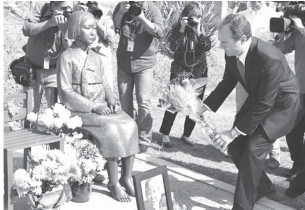
2014年4月22日、米ロサンゼルス郊外グレンデールで、従軍慰安婦問題を象徴する少女像に献花するシフ議員

「バンクーバー新報」3月12日付け「ブリティッシュ・コロンビア州バーナビー市デレク・コリアン市長は10日、バンクーバー新報の電話インタビューに際し、第2次世界大戦中の慰安婦像(平和の少女像)の建立についてまだ議論している段階と語った。