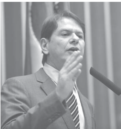
18日の議会でのシジ氏

シジ氏召喚は、同氏が3週間前にパラ州州議会で行った講演で、クーニャ氏が「シジ氏は汚い連中が300〜400人いる」と発言したことを問題視してのことだった。午後3時頃には、シジ氏は個人質疑応答で、シジ氏は個人的な謝罪を行ったものの、クーニャ氏からの擁護がなかった。シジ氏は「野党には与党でやるべきことがある。それが出来ない」とも発言。クーニャ議長は「野党は与党を去るべきだ」とも発言。クーニャ議長は連立与党の議員が連邦政府を提出した法案の状況を批判した。その後も、セルジオ・スヴェテル下議(社会民主主義・PSD)から「ピエロ」と批判されて口論となった。シジ氏は議長に