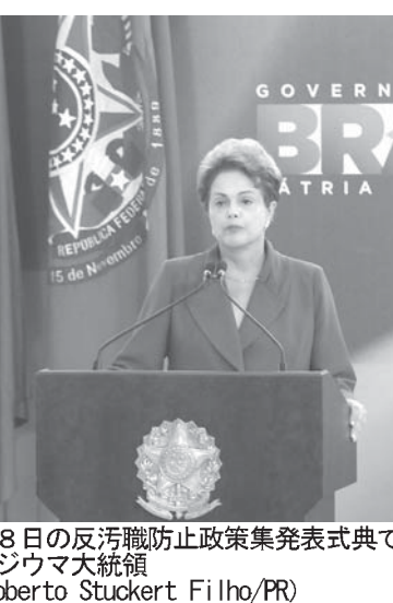
18日の反汚職防止政策集発表式典でのシジ大統領

に盛り込まれた七つの政策的うち、五つはまた議会の通過して、一つは期日目標も定まっていない。七つの政策の中で唯一、即座に効力を発揮するのは、2013年9月に大統領令で発せられた「14年汚職法」の施行細則だ。18日に発表された反汚職法の主要細則は、公的機関との契約で汚職が告発された際の罰金や、汚職調査に協力した場合、どの程度の罪の軽減があるかを細かく決めている。公的機関と事業契約を行った企業は、汚職摘発された際の罰金は、収益の0.1%〜20%、収得利益が不明な場合は最高6%