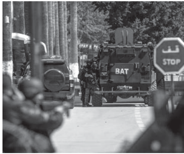
九州電力川内原発。左から1号機、2号機=鹿児島県薩摩川内市

【チュニス共同】北アフリカ・チュニジアの首都チュニスの国立バルド博物館で18日午後0時半(日本時間午後8時半)ごろ、武装集団が観光客らを襲撃し、銃を乱射した。チュニジア政府は外国人観光客18人を含む計21人が死亡し、40人以上が負傷したと発表。日本政府は19日、日本人3人が死亡、3人が負傷したことを確認した。安倍晋三首相は官邸で記者団に「テロは断じて許されない。強く非難する」と述べた。武装集団の2人は治安部隊に射殺された。