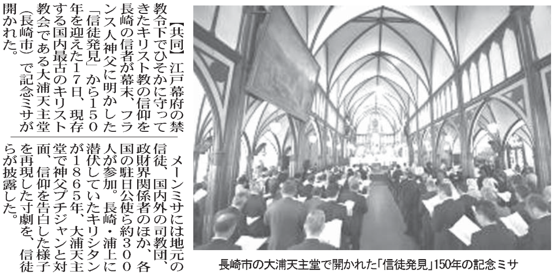
長崎市の大浦天主堂で開かれた「信徒発見」150年の記念ミサ

【共同】政府は17日、小学校と中学校の義務教育9年間のカリキュラムを弾力的に運用できる小中一貫校を制度化する学校教育法改正案を閣議決定した。一貫校の名称は「義務教育学校」とし、小中学校などと同じ法第1条で定める「学校」に位置付けた。今国会で成立すれば、2016年4月から施行する。義務教育学校は、地域の実情に合わせて、カリキュラムや学年の区切りを変更できる。校長は1人で、教員は原則として小中両方の免許が必要。校舎は離れていても、同敷地内でも設置できる。