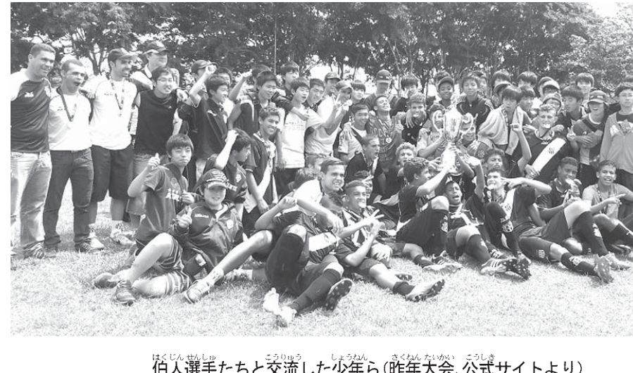
伯人選手たちと交流した少年ら(昨大会、公式サイトより)