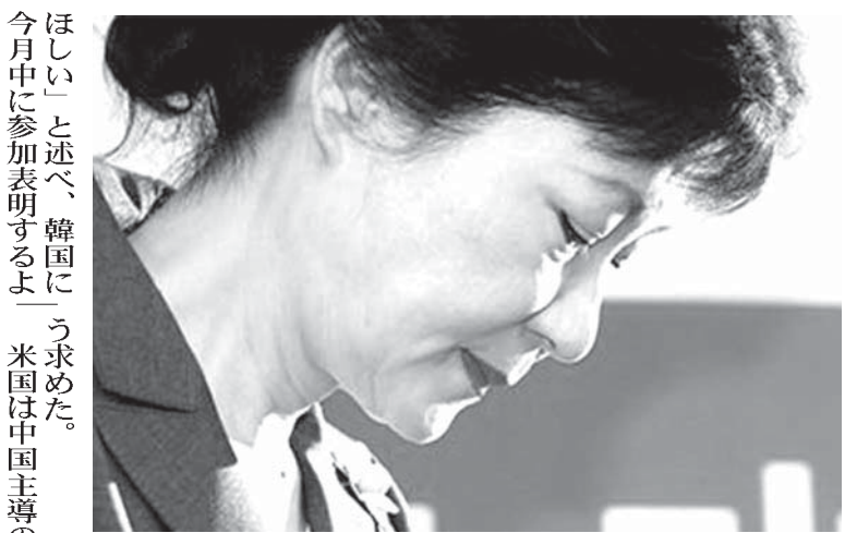
米韓双方からの圧力に直面し苦悩している韓国の朴槿恵大統領

【共同】政府は17日、小学校と中学校の義務教育9年間のカリキュラムを弾力的に運用できる小中一貫校を制度化する学校教育法改正案を閣議決定した。一貫校の名称は「義務教育学校」とし、小中学校などと同じ法第1条で定める「学校」に位置付けた。今国会で成立すれば、2016年4月から施行する。義務教育学校は、地域の実情に合わせて、カリキュラムや学年の区切りを変更できる。校長は1人で、教員は原則として小中両方の免許が必要。校舎は離れていても、同敷地内でも設置できる。 現在の義務教育の「6・3」制については、中学校に進学した際に小中一貫校が増える「中一キップ」や、子どもの心身の発達が早まり、学年の区切りが現状に合っていない点などが指摘されており、一貫校の導入でこれらの課題の解決を図る狙いがある。 下村博文文科相は17日の記者会見で、「一貫校の導入は、義務教育の質を向上させるための重要な取り組みだ」と強調した。