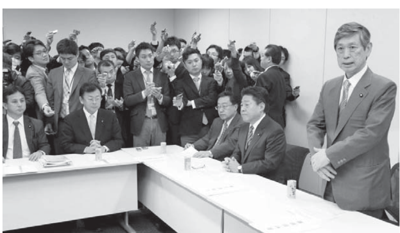
自民党の安倍首相（右端）は、20日午後、衆議院第2議員会館で、安全保障法制に関する与党協議会を開き、新たな安保法制の骨格について正式合意した。隣は公明党の北側副代表＝20日午後、衆議院第2議員会館

【共同】自民、公明両党は20日、新たな安全保障法制に関する与党協議会を開き、集団的自衛権行使や米軍を含む他国軍への後方支援など、幅広い分野で自衛隊活動を拡大させる法制の骨格について正式合意した。憲法解釈を変更した昨年7月の閣議決定を受けた安保法制の大枠が固まった。海外派遣時の国会事前承認など阻止の明確化は持ち越しており、なほ崩壊的に活動が広がる懸念が残る。