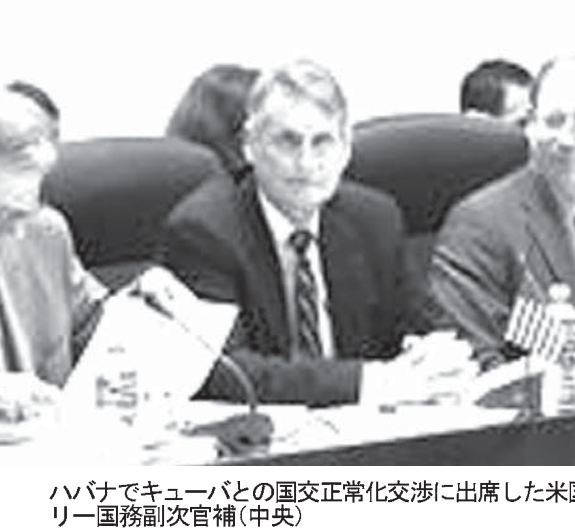
ハバケでキューバとの国交正常化交渉に出席した米国のリー・國務副次官補(中央)

【共同】同性愛や性的少数者など性的少数者(LGBT)への差別解消を目指す超党派議員連盟が17日、設立総会を国会内で開いた。欧米諸国などでLGBTへの関心を高める中、2020年東京五輪・パラリンピックを意図し、各国の事例の研究などを進め、人権問題として解決に取り組む方針だ。LGBTに関する課題を考える議員連盟。総会には、自民党や民主党など野党から約30人が参加。月1回程度の会合を開き、同性愛者へのヒアリングも行う予定だ。LGBTへの差別問題をめぐっては、ロシアで昨年2月に開催されたソチ冬季五輪前に、ロシアが同性愛者禁断法を制定したことに各国が反発。オバマ大統領が一部首脳が開会式を欠席した。