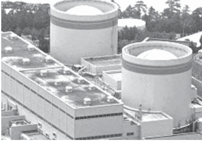
廃炉が決まった美浜原発1号機、2号機

【共同】関西電力と日本原子力発電が老朽原発3基の廃炉を決めた。中国電力と九州電力も2基の廃炉に踏み切る。全国に広がった原発は東京電力福島第1原発事故後の規制強化で一転、廃炉時代へ。政府や電力会社には、脱原発依存の実績を強調して再稼働への抵抗を和らげたいとの思惑が透ける。一方、原発に依存してきた自治体は、廃炉後の地域の将来像を描けずにいる。