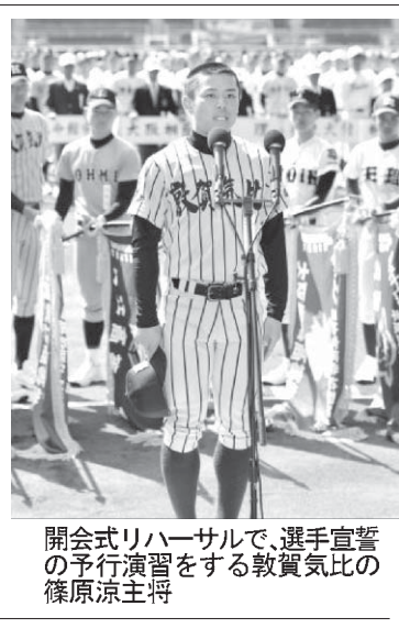
【共同】第87回選抜高校野球大会は21日に甲子園球場で開幕し、出場32校による12日間...