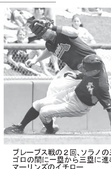
【共同】イチローが果敢な走塁を見せた。「アウトに...