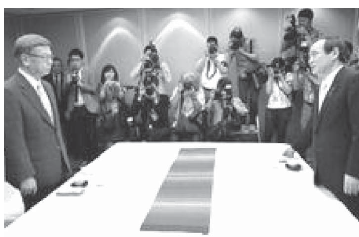
会談に臨む沖繩県の翁長雄志知事（左）と菅官房長官

【共同】菅義偉官房長官は5日、沖繩県の翁長雄志知事と那覇市のホテルで初めて会談し、米軍普天間飛行場（宜野湾市）の名護市辺野古移設について「日米同盟と抑止力の維持、危険性除去を考えたときに唯一の解決策だ」と理解を求めた。翁長氏は「辺野古の新基地は絶対に建設できない」と確信を持っていると、辺野古移設阻止の意向を表明。会談は平行線をたどった。両氏とも対話継続は明言したが、歩み寄りは見通せない。翁長氏は安倍晋三首相との面談も要請し、政府と県で調整する。