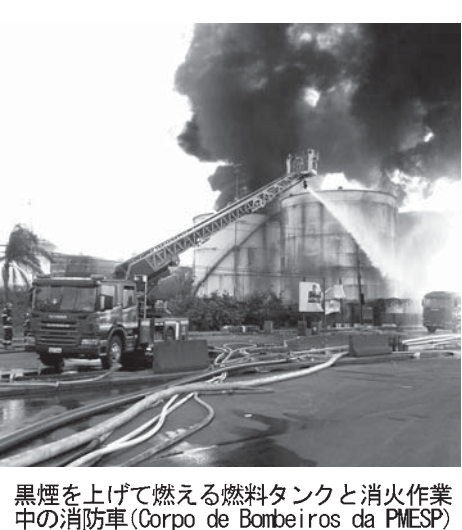
黒煙を上げて燃える燃料タンクと消火作業中の消防車

既報関連 聖州海岸部サンタ市で2日朝起きた輸送会社の燃料タンク火災は6日も続き、大気汚染や魚の大量死、トラカルの燃料タンクで、2日に4基が炎上し