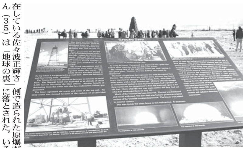
世界初の核実験に成功した「トリニティ・サイト」の案内板。奥は爆心地を示す碑

【共同】米軍は4日、1945年に人類史上初の核実験が行われた西部ニューメキシコ州アラモゴード近郊の「トリニティ・サイト」を一般公開した。戦後70年と重なった今年は、例年の公開時より関心が高く、過去最多の5534人が訪れた。広島、長崎への原爆投下は是非を訪問者に尋ねると、終戦を早め日米両国の犠牲者を減らしたとの認識が共通し、正当化