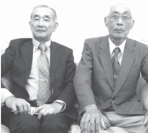
杉浦副会長(左)と手嶋会長