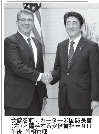
官長防衛相中谷元(右)と米国防長官カーター(左)が8日午後、首相官邸で会談し、握手する。

【共同】中谷元・防衛相と米国のカーター国防長官は8日午前、防衛省で会談し、今月下旬に予定する自衛隊と米軍の役割分担を定めた日米防衛協力指針(ガイドライン)改定に向け協議を加速させる方針で一致した。米軍普天間飛行場(沖縄県宜野湾市)移設に