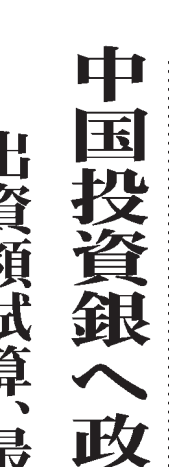
中国投資銀行へ政府対処案を出す意向を示す。

【共同】中国が主導して設立するアジアインフラ投資銀行(AIIB)のラオス政府の対処方針案が7日判明した。