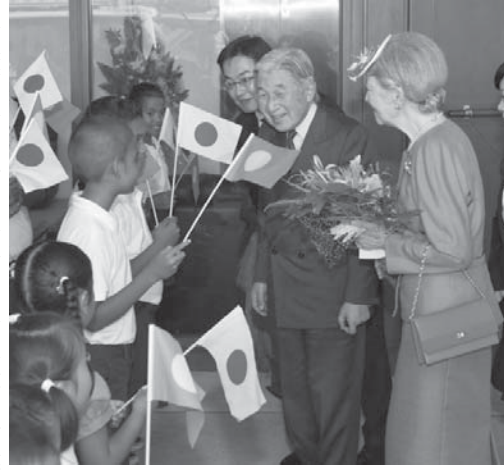
パラオ国際空港に到着し、地元の子供たちから歓迎を受ける天皇、皇后両陛下。8日

「コロル共同」天皇、皇后両陛下は8日午後、太平洋戦争の戦没者を慰霊するため、パラオを初めて訪問された。