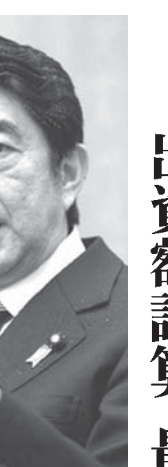
中国投資銀行へ政府対処案を出す意向を示す。

【共同】中国が主導して設立するアジアインフラ投資銀行(AIIB)のラオス政府の対処方針案が7日判明した。