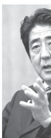
中国投資銀行へ政府対処案を出す意向を示す。

【共同】中国が主導して設立するアジアインフラ投資銀行(AIIB)のラオス政府の対処方針案が7日判明した。