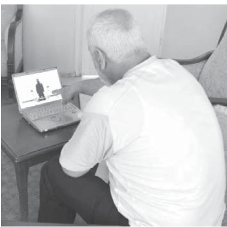
本人写真。シリア人男性(45)が7日までに、殺害されたとみられる後藤健二さん(47)、湯川遥菜さん(42)と同じ施設にいたと証言、外国人房への配膳係を務め「私が鉄格子越しに食事を運んだ」と話した。滞在先のトルコ南東部シヤムルファで共同通信の取材に応じた。

【共同】過激派組織「イスラム国」が7日までに、殺害されたとみられる後藤健二さん(47)、湯川遥菜さん(42)と同じ施設にいたと証言、外国人房への配膳係を務め「私が鉄格子越しに食事を運んだ」と話した。滞在先のトルコ南東部シヤムルファで共同通信の取材に応じた。