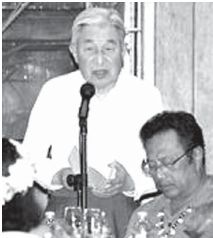
天皇陛下と皇后陛下の晩さん会であいさつされる。