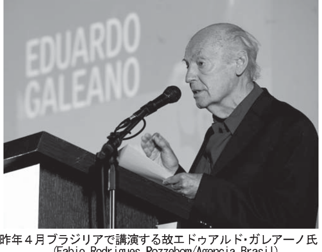
昨年4月ブラジルで講演する故エドゥアルド・ガレアーノ氏

ウルグアイ人ジャーナリストで作家のエドゥアルド・ガレアーノ(Edoardo Galeano)が、13日朝、ウルグアイの首都モンテビデオで、妻と3人の子供を残して亡くなった。 1971年に発表された『収奪された大地』が、ラテンアメリカ左翼の古典的名著とされる『収奪された大地』(ポ語題「1971年に発表された『収奪された大地』」)が、2009年の第5回