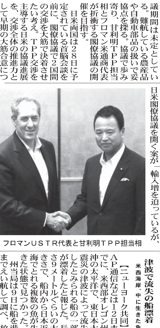
フロマンUSTR代表と甘利明TPP担当相

【共同】環太平洋連携協定(TPP)政府対策本部は13日、TPP交渉の日米事務レベル協議を15日から東京都内で再開すると発表した。協議内容は未定としている。難航している農産品や自動車部品の扱いや協定を巡るTPP担当官とフロマン米通商代表が折衝する関係協議の開催を目指す。