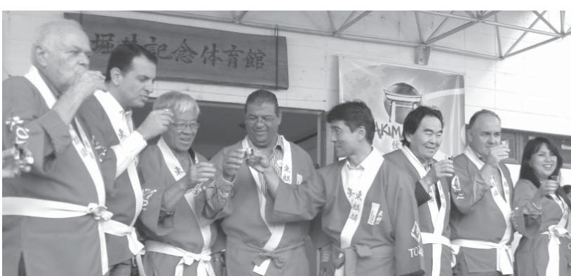
乾杯の30回を祝った。鏡割りの30回を祝った。