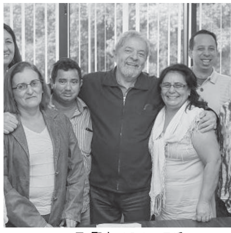
7日、聖市でのルーラ氏

ルーラ氏は在任期間中に年平均5%を超える経済成長を遂げており、任期最終年で、年7.5%の成長を記録した2010年の11月には、「史上最高の大統領」とする声が高まった。しかし、PT政権の後継者としてジウマ氏を選んだのがルーラ氏自身であったことや、連日報道されているラウア・ジャットの汚職問題が自身の政権時(2004〜10年)に展開されたこと、さらには「本当に何も知らなかったのか」との疑いを持たれていることなどがあると考えられる。その一方、政敵であるPSDBのカルドゾウ氏