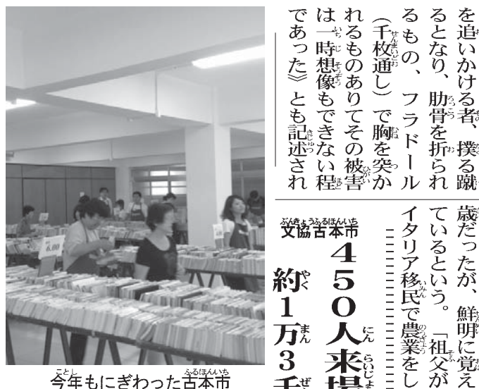
今年にもぎわった古本市

オリーヤ 外務省が明らかにしたジャパハウスの概略を24日付で詳報した。日系社会はどのような形で関われるのか。個人的には文協やアリアンサとの連携に期待している。文協ビル地下の旧接協診療所は現在、文化空間スペースとして改修する計画がある。同ハウスの支所的な位置づけにして主に日系人向けの事業を集中して展開すれば効果が良いかも。アリアンサはビニエイロス校を改築中で、年内にもお披露目される。延べ床面積はジャパハウスに比べ一割に満たないが、ホール、講義室、調理室とあり、「支所」としては十分な感じか。