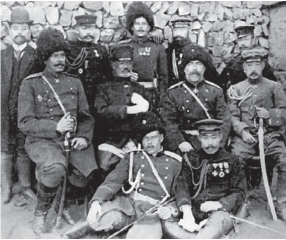
中央左が乃木希典大將、右がアナトーリー・ステッセリ