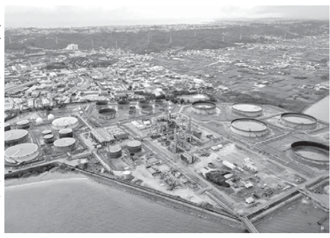
南西石油=2010年7月(提機紙=沖縄タイムス2015年3月28日)