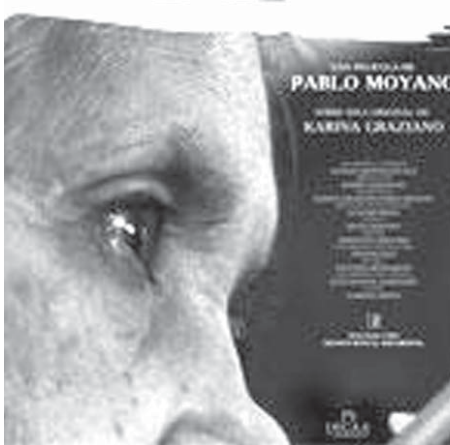
アルゼンチンで公開された映画『Silencio Roto-16 nikkeis』のポスター

「皇帝陛下！」 「あ、いつも皆が噂をする皇帝だったのか。皇帝は細かい声でおっしゃられた。どうか、伍長……。私の側近として従卒となり、伝令役を務めてもらいたい。どうだね？」 「分らないことがありませんか？……一八四五の時から。あの晩に閣下のお手元に機密書類をお届けしたのが自分であり、命令に従って任務を果たす……今日から、これが自