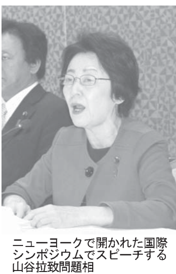
国際問題に関するシンポジウムでスピーチした山谷直子（左）

【ニューヨーク共同】拉致問題など北朝鮮の人権侵害をテーマにした日本政府主催の国際シンポジウムが5日午前（日本時間同日夜）、米ニューヨークで開かれた。山谷直子拉致問題担当相が基調講演し、拉致は一人権侵害であるだけでなく、国家主権の重大な侵害で、テロにも等しいと非難、被害者の帰還を求める立場を強調した。