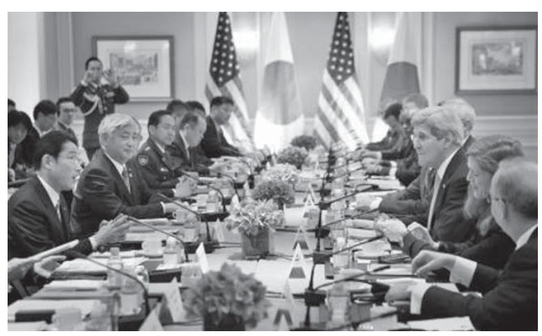
日米両政府は4月27日、ニューヨークで外務・防衛担当閣僚による安保協議委員会を開き、18年ぶりに防衛指針を改定、地球規模へ協力拡大を打ち出した。

【共同】日米両政府が18年ぶりに防衛協力指針(ガイドライン)を改定した。海洋進出を強める中国を念頭に、日米の軍事一体化に拍車がかかる。米国の地域や世界の安定のため負担の肩代わり圧力も高まりそうだ。自衛隊活動は地理的制約が外れ、地球規模に範囲を拡大。安倍政権が憲法解釈変更で認めた集団的自衛権行使に当たる任務も規定し、質量ともに変容する。