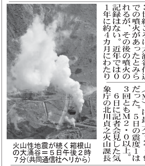
箱根山(山時)から大涌谷(共同通信社)で噴火が起きた。噴火警報が引き上げられた。噴火が起きた場合、大きな噴石に警戒が必要なほか、風下でも火山灰や小さな噴石に注意するよう呼び掛けられた。

【共同】気象庁は6日、箱根山(神奈川県箱根町)の大涌谷周辺で、小規模な水蒸気噴火が発生する恐れがあるとして、噴火警報を1(平常)警戒レベルを1(平常)から2(火口周辺規制)に引き上げた。噴火が起きた場合、大きな噴石に警戒が必要なほか、風下でも火山灰や小さな噴石に注意するよう呼び掛けられた。箱根山は2009年3月に警戒レベルが導入され、引き上げは今回が初めて。対象自治体は箱根町。5日に観測した火山性地震は観測史上最多の116回を記録した。箱根町は6日、大涌谷から半径300メートルに避難指示を発表。既に立ち入りを規制しているハイキングコースに加え、大涌谷へ向かう県道も通行止めにした。ロープウェイも運転を見合わせた。バスもルートを変更するなどした。5日、気象庁によると、大涌谷に発生した震度1の地震3回のうち、午前6時台の2回は地表に近い場所が震源だった。一方、午後9時台の1回は深さ約5キロで、より山の内部が震源となった。その上部が熱水の状態で不安定に