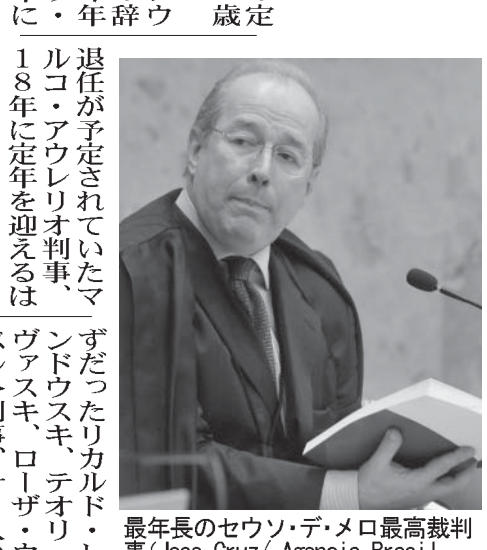
最高裁判官のセウソウ・デ・メロ最高裁判官 (Jose Cruz/ Agencia Brasil - 17/12/2012)

連邦下院が5日、高等裁判所裁判官の定年を75歳までに延長する憲法補正案(PEC)の2度目の投票を行い、法案を承認した。6日付付字紙が報じた。