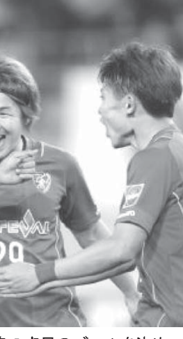
鳥栖は清水と引き分け

【共同】明治安田J1第1ステージ第10節第2日(6日)ユアテックスタジアム仙台ほかJ1各試合。2位のFC東京が武藤の2ゴールなどで仙台を下し4連勝した。