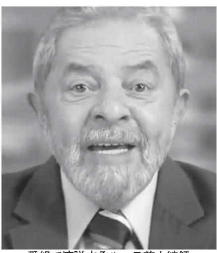
番組で演説するルーラ前大統領 (reproducao)

5日後、午後8時30分からの10分間、労働者党(PT)の宣伝放送が行われたが、それと同時に、鍋を叩いて現政権への抗議の意思を示す「パネラツソ」が全国各所で確認されている。18州と連邦直轄区で発生した6日付付字紙が報じた。この抗議行動はイン