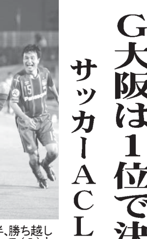
G大阪は1位で決勝Tへ

【共同】サッカーのアジアチャンピオンズリーグ(ACL)は6日、各地で1次リーグ最終戦が行われた。F組のG大阪は大阪・万博記念競技場で城南(韓国)に2-1で逆転勝ちし、同組1位で決勝トーナメントに進出を決めた。