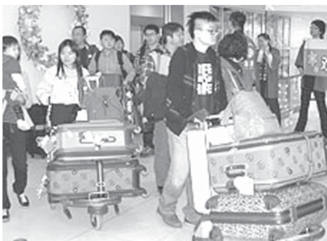
続々と空港に降り立つ観光客

【共同】東京入国管理庁は12日、ゴールデンウィーク期間中（4月24日～5月6日）の成田、羽田両空港の出入国者数（速報値）を発表した。成田は昨年同様に12.7%増の約91万人で、2012年以来3年ぶりの増。羽田も16.1%増の約43万人となり、合計も13.8%増の約134万人となった。東京入国管理庁は「国際線の新規就航や増便が相次いだことや円安などが追い風となったのではないか」と説明している。