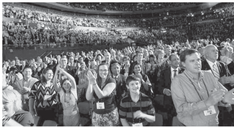
昨年、オーストラリア・シドニーであったロータリー国際大会の様子