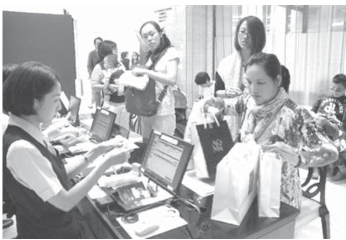
買い物袋を提げた訪日外国人でごった返す高島屋大阪店の免税カウンター

【共同】財務省が13日発表した2014年度の国際収支速報によると、海外とのモノやサービス、投資の取引状況を示す経常収支の黒字額は7兆8100億円となった。前年度（1兆4715億円）を上回り、4年ぶりに拡大した。旅行者のお金の出入りを示す「旅行収支」は2009年以降の黒字。訪日旅行者の増加で、1959年度以来55年ぶりに黒字となった。