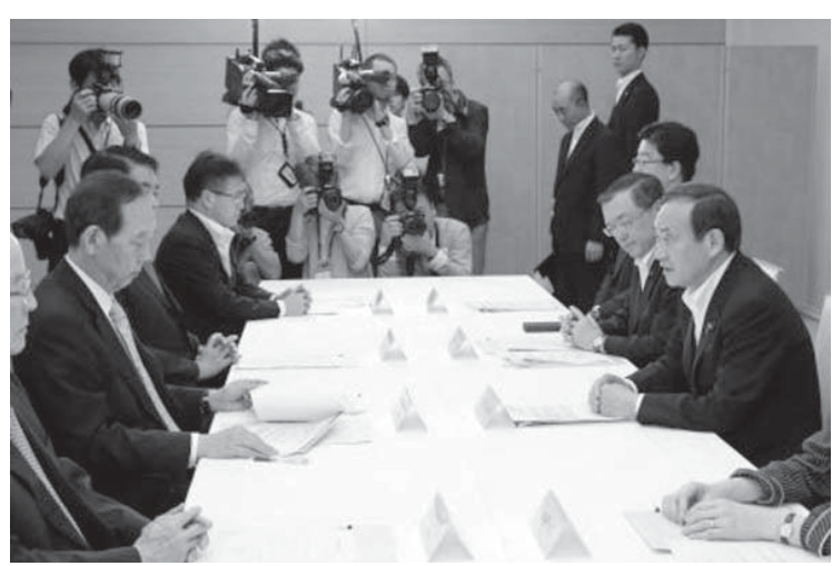
原発から出る核のごみの最終処分をめぐる関係閣僚会議であいさつする菅官房長官(右端)＝22日午前、首相官邸

【共同】政府は22日、原発から出る核のごみ（高レベル放射性廃棄物）の最終処分に関する新しい基本方針を閣議決定した。自治体の応募に頼った従来の方式を転換し、火山や活断層を避けて「科学的有望地」を国主導で提示する仕組みを導入する。