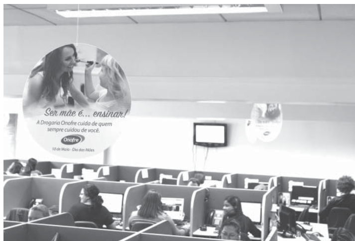
日本語専門のオペレーター

薬局「Onofre」が先駆け、電話による日英(オノフレ、サイト)先月から、医薬品市場でポ3カ国語での接客サービスを開始した。