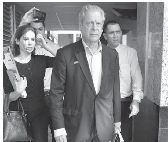
ジルセウ元官房長官

ラヴァ・ジャット事件り、国外逃亡を恐るおそるバナン連邦地裁のセルジョ・モロロ氏は、パスコヴィッチ氏を再逮捕を命じた。同氏は兄弟のジョゼ・アドルフ氏も汚職への関与の嫌疑をかけられ、連署での供述後に釈放された。裁判所はまた、両氏の預金7800万レアルの封鎖を命じた。パスコヴィッチ氏は、同社のJAMPエンジェビックス・アソシエイドス社(JAMP)は、04年と14年にEJVから8千万レアル以上を受け取った。同社は同様にP.B.を巡る汚職に関与したとされるオデブレヒトやU.T.C.からも多額の金を受け取っている。