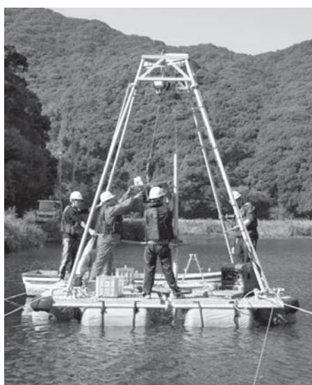
高知県土佐市の蟹ヶ池で津波堆積物を調査する。高知大の研究者らによる調査で、2013年11月

【共同】東海、東南海、南海地震の3連動で起きたとされる宝永地震(1707年)に匹敵する巨大地震が、過去約7300年の間に6回発生していたことが三重県南部の池の津波堆積物調査で分かったと、高知大と名古屋大のチームが13日発表した。