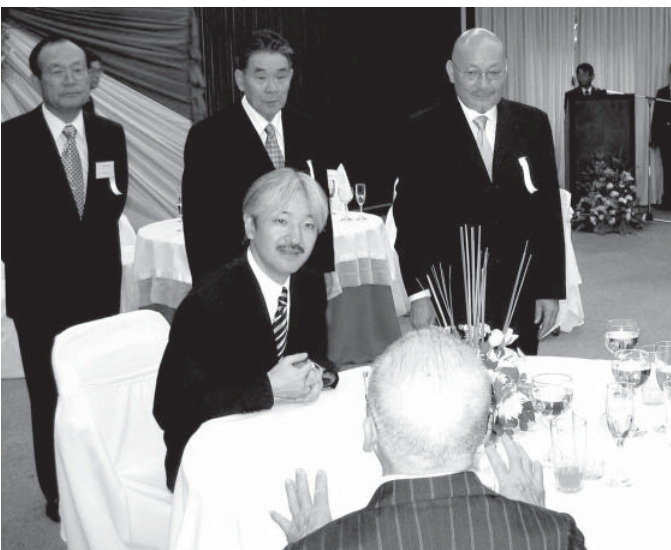
06年パラグアイ訪問時に孝移民から話を聞いた秋篠宮ご夫妻

とって初めて対等条約が結ばれ、移民政策が開始するきっかけとなった。NHKによれば、秋篠宮ご夫妻は10月下旬から11月上旬ごろで、調印日に合わせ開催されるであろう記念式典に出席される可能性がある。ご夫妻は、南米はブラジルは移民80周年の1988年以来、当時は礼賓殿として、移民の日に合わせて6月16〜24日に聖市、リオ、ブラジリアほかパラナ州、ローランジア、パライ州、ベレンなどを訪問した。生物学への高い関心から、アマゾン州マナウス市にあるアマゾン自然科学博物館(現