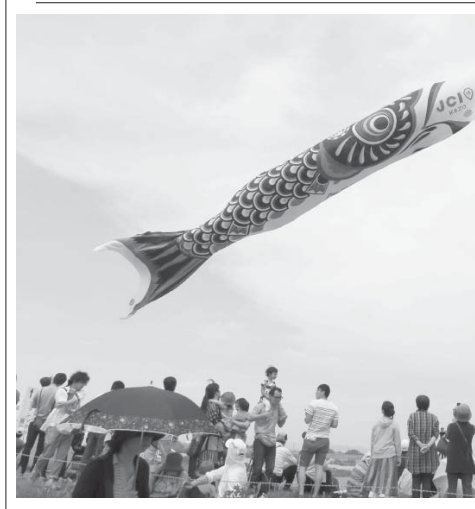
利根川河川敷で、大空を泳ぐ全長100メートルの「ジャンボこいのほり」=3日、埼玉県加須市

【共同】文科省は4月28日、大学の設置を申請した際に不正行為があったとして、幸福の科学学園(栃木県那須町)に対し、5年間認可せずと通知した。